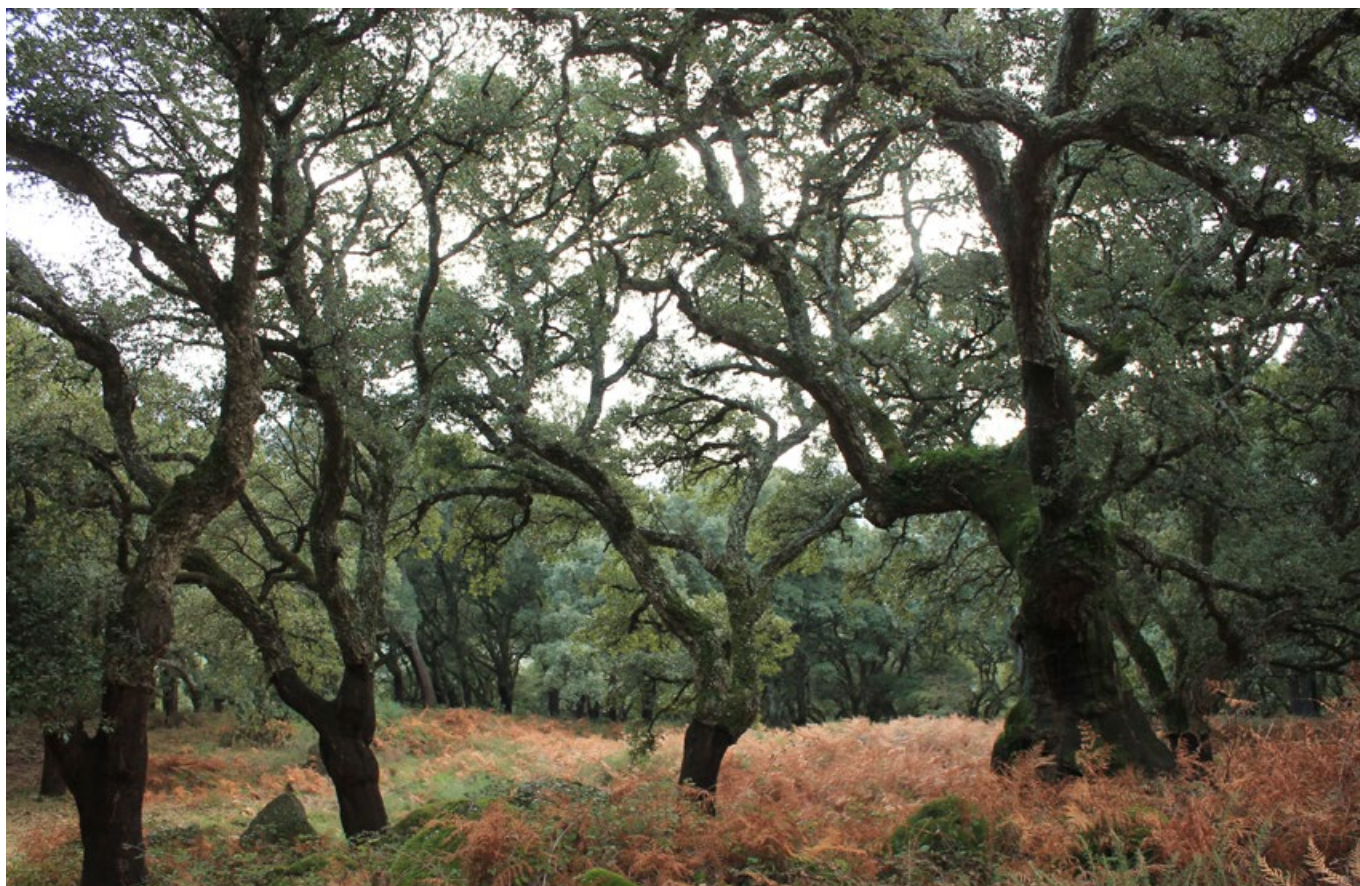
Alzines sureres al Parc Natural de Los Alcornocales.

La restauració de masses forestals i la creació de nous boscos en espais «residuals» urbans és una bona manera de potenciar els espais verds urbans i mitigar els efectes del canvi climàtic. A més, aquests petits boscos urbans poden comportar múltiples beneficis, com ara els que s'expliquen a continuació: