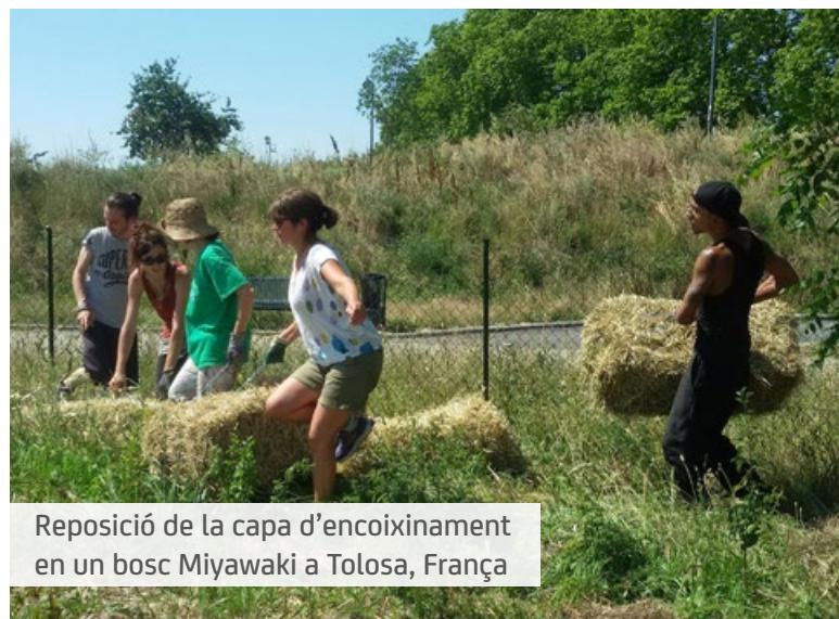
Reposició de la capa d'encoixinament en un bosc Miyawaki a Tolosa, França