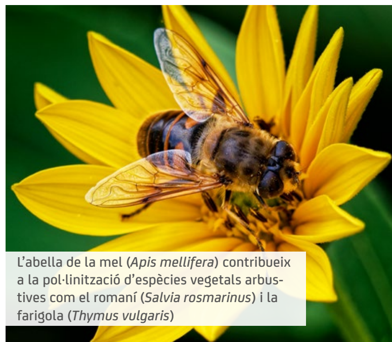
L'abella de la mel ( Apis mellifera ) contribueix a la pol·linització d'espècies vegetals arbustives com el romaní ( Salvia rosmarinus ) i la farigola ( Thymus vulgaris )

A més, aquest seguiment permet fer els ajustos necessaris per potenciar la resiliència del bosc davant de factors externs, com el canvi climàtic o la pressió humana.