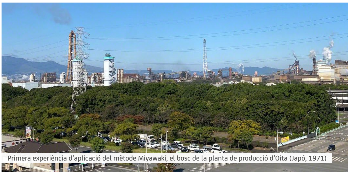
Primera experiència d'aplicació del mètode Miyawaki, el bosc de la planta de producció d'Oita (Japó, 1971)

Un bosc desenvolupat a partir del mètode Miyawaki consisteix en un seguit de comunitats de plantes que pretenen recrear un ecosistema forestal tal com existiria de manera natural sense intervenció humana.