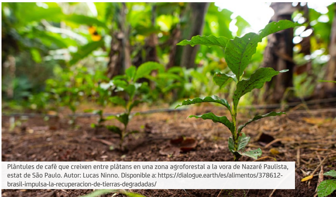
Plàntules de cafè que creixen entre plàtans en una zona agroforestal a la vora de Nazaré Paulista, estat de São Paulo.

Totes aquestes característiques indiquen la composició del sòl, però hi ha certes mesures que es poden prendre per millorar-ne el rendiment, com ara l'addició de substrats i de fertilitzants orgànics.