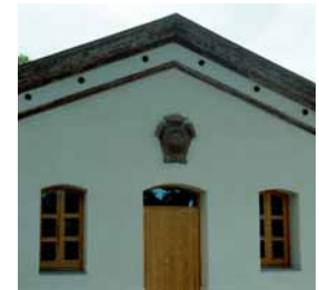
Casa de la Mina

El Reixagó o casa de la Mina és un edifici construït en temps del rei Carles III, situat enmig d'una frondosa arbreda, des del qual es feia la partició de cabals entre el rec Comtal i la mina Antiga de Montcada. Per sota, surt a l'exterior la conducció d'aigües que originava el Rec. A la façana, una làpida n'explica els antics usos i la data de construcció (finals del segle XVIII). La doble alineació de plàtans que seguia el camí fins a la porta és un signe clar de la seva importància en el passat.