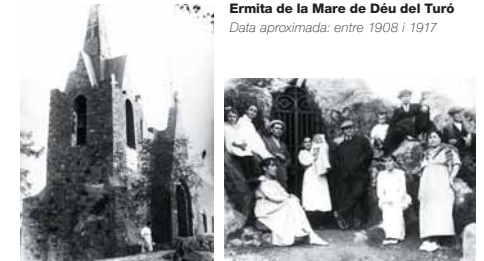
Ermita de la Mare de Déu del Turó