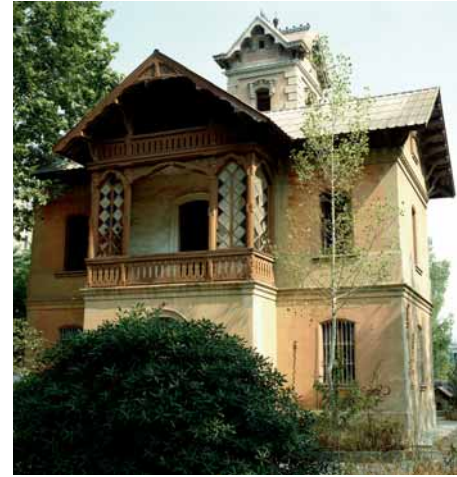
Casa del director

Es tracta d'un recinte d'estil modernista, construït el 1878, format per tres edificis i una torre envoltats de jardins. L'autor del projecte va ser l'arquitecte Antoni Rovira i Trias. El primer edifici consta de tres grans sales (la dels pous, la de les calderes i la de les màquines de vapor).