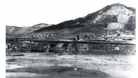
Les primeres extraccions de l'Asland. L'ermita encara és dalt del Turó. Tocant al riu, la zona actual del Parc amb les instal·lacions de les Aigües de Montcada

La fàbrica de ciment Asland, instal·lada al turó per tal d'extreure'n material, va comportar canvis importants en el destí del municipi. Amb ella, Montcada va iniciar el procés d'industrialització, alhora que deixava de ser destí preferent d'estiueig de la burgesia barcelonina. L'explotació de les calcàries del turó ha contribuït notablement a desdibuixar el paisatge de la vila i ha destruït una muntanya que era alhora referència històrica, fita paisatgística i indret tradicional de trobada dels montcadencs.