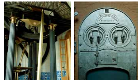
Màquina de vapor

Pous, calderes i màquines, encara ben conservats, són autèntiques joies de l'arqueologia industrial. En el segon edifici, hi ha la sala de control amb una gran piscina per a verificar el rendiment dels pous. El tercer edifici era la casa del director. El 1989, després de més d'un segle de funcionament, la creixent contaminació de les aigües va obligar al tancament dels pous.