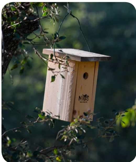
Caixa niu d'ocells