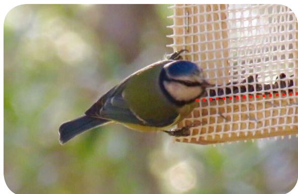
1. Mallerenga blava

Busco petits forats als arbres per fer el meu niu.