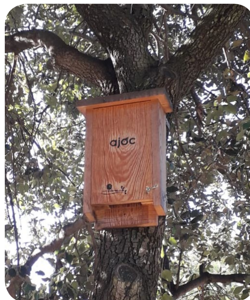
Caixa niu de ratpenats

A continuació hi ha vuit afirmacions relacionades amb les caixes niu. Si són certes, marca amb una X la columna «cert» i, si no ho són, marca amb una X la columna «fals».