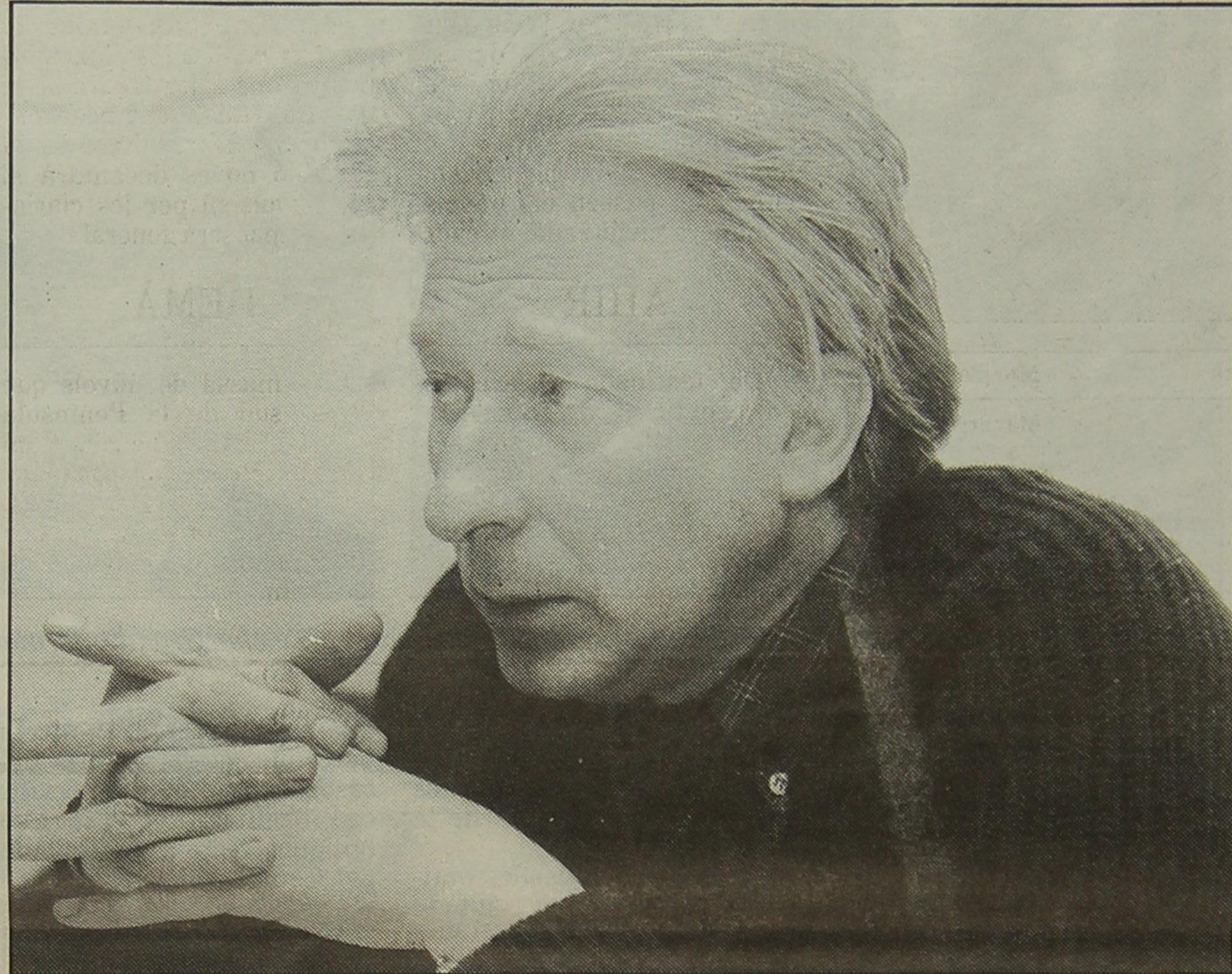
Boadella pensa que a Barcelona és quasi impossible mantenir un amor estable

ra massificada pseudomilitaritzada no m'agrada gens. A part, crec que és un negoci excel·lent per uns quants. I em sembla bé que ells s'ho organitzin, però que a més a més que reclutin voluntaris ja no m'ho sembla tant.