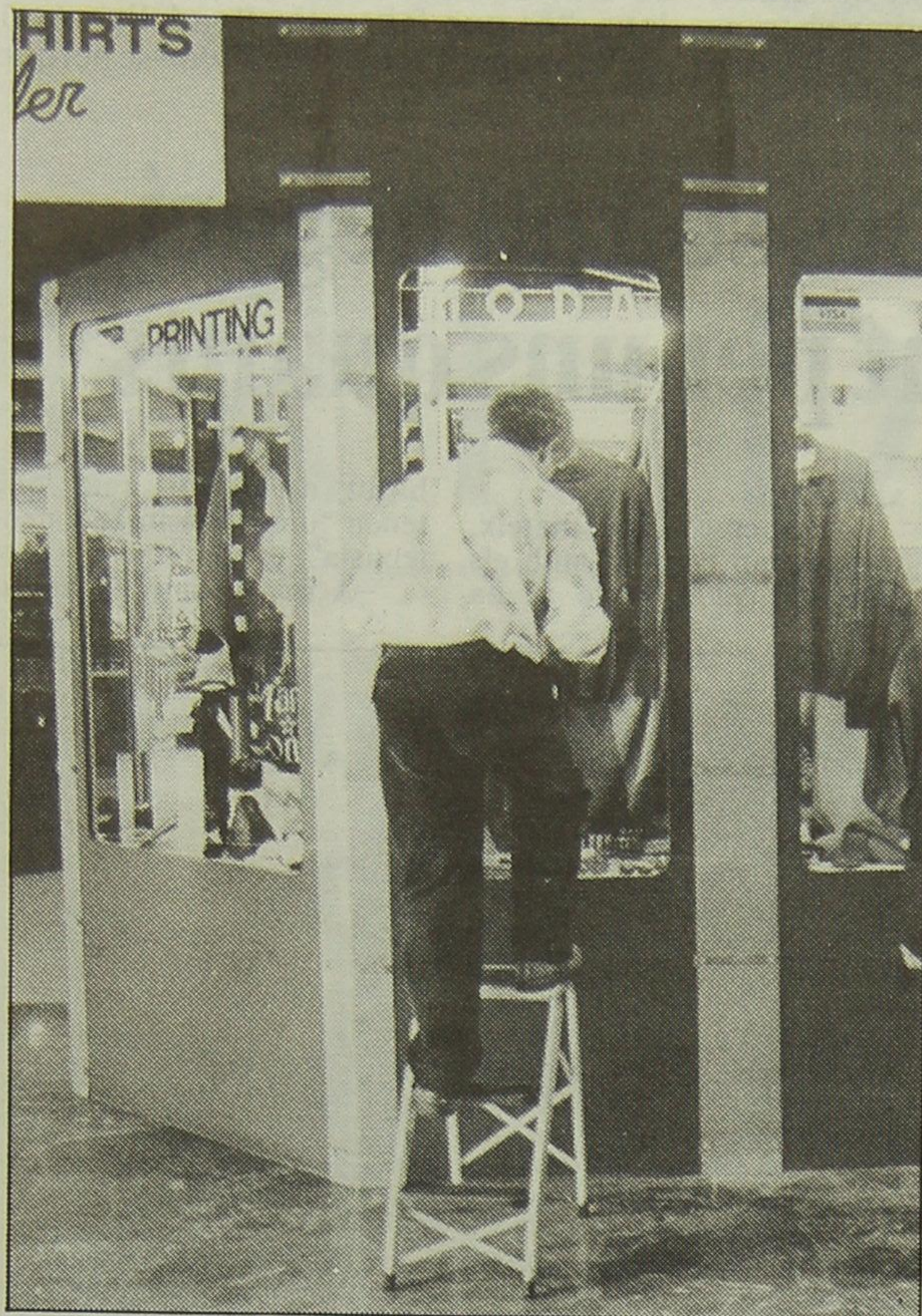
A les dues botigues de les estacions de Sants i Universitat funcionarà el Telèfon Groc d'informació del transport

Igualment, en aquestes botigues el client podrà adquirir tot tipus d'articles relacionats amb actes ciutadans. Des de les samarretes dissenyades pel Patronat Municipal de Turisme fins als típics articles que surten a la venda amb motiu de les festes de Barcelona, com les samarretes o els gadgets comercialitzats per les festes de la Mercè o les festes del barri de Gràcia. Previsiblement també es comercialitzaran tots els gadgets dels Jocs Olímpics del 92.