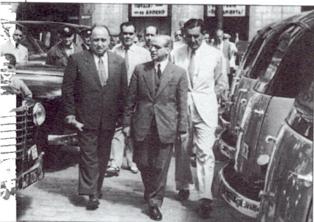
1953 entrega de taxis