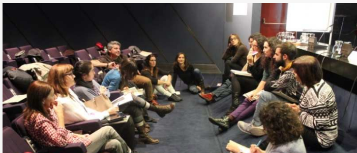
Membres del grup de treball professorat: debat grupal per proposar actuacions per superar els reptes