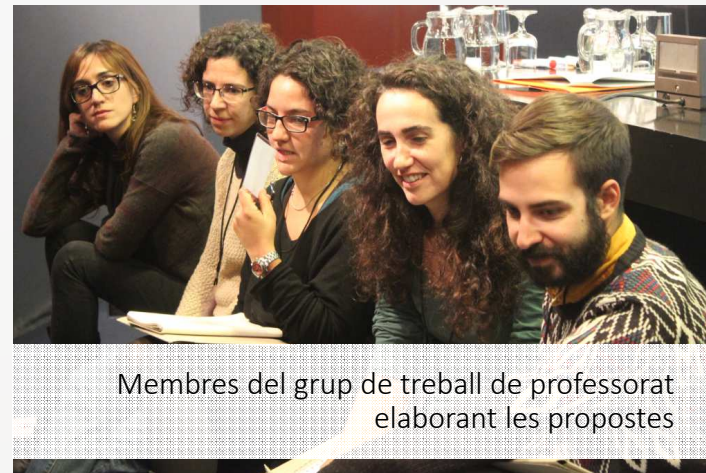
Membres del grup de treball de professorat elaborant les propostes