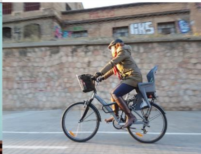
Benvinguts al blog