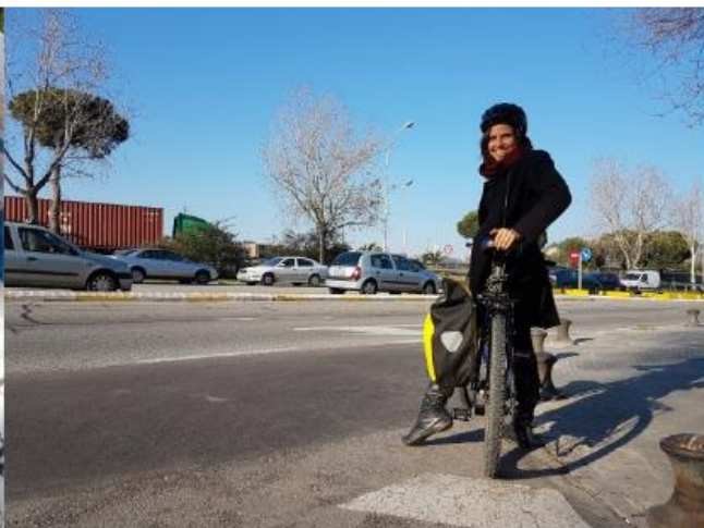
#AMBbici a la feina