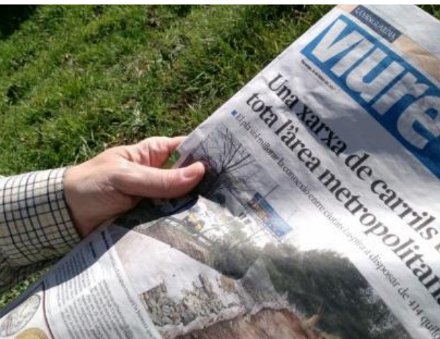
La Bicivia, canvi d'hàbits?