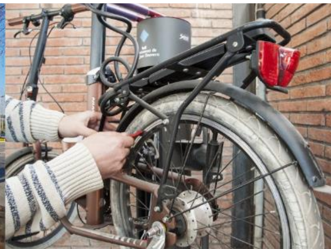
Punt bici a Sant Just