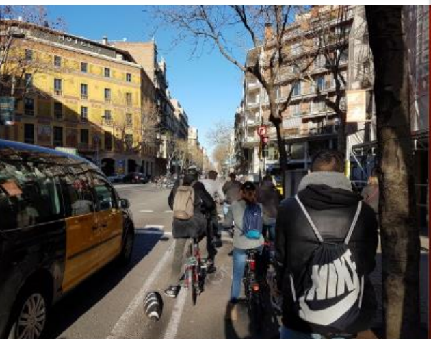
Cada dia més