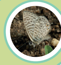
BLAVETA ESTRIADA LEPTOTES PIRITHOUS