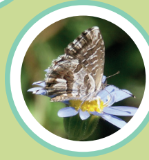
BARRINADORA DEL GERANI CACYREUS MARSHALLI