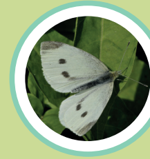
BLANQUETA DE LA COL PIERIS RAPAE