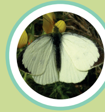
BLANCA DE LA COL PIERIS BRASSICAE