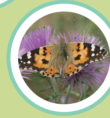
MIGRADORA DELS CARDS VANESSA CARDUI