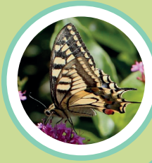
PAPALLONA REINA PAPILIO MACHAON