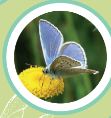
BLAVETA COMUNA POLYOMMATUS ICARUS