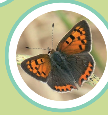
COURE COMÚ LYCAENA PHLAEAS