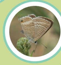
BLAVETA DELS PÈSOLS LAMPIDES BOETICUS