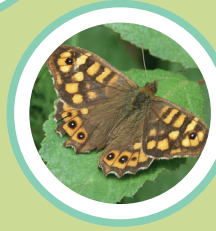
BRUNA DE BOSC PARARGE AEGERIA