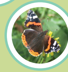
ATALANTA VANESSA ATALANTA