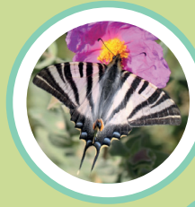
PAPALLONA ZEBRADA IPHICLIDES FEISTHAMELII