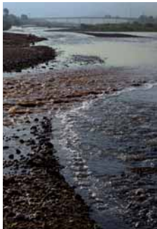
Aiguabarreig del Sec i el Ripoll