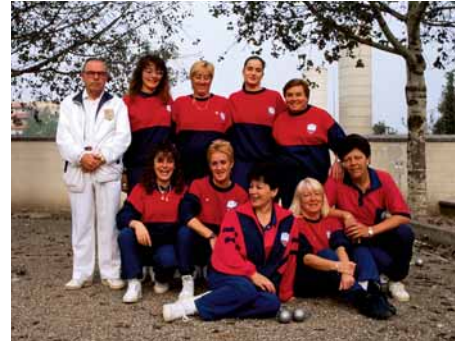
Club de Petanca Ripollet (equip femeni) al parc del Masot, 1996

Fins als anys 70, en què es va fer l'autopista i la carretera de Cerdanyola a Ripollet, les terres dels parcs del Masot i de Maria Regordosa eren una única peça de conreu, a tocar dels 2 rius. Probablement, aquest emplaçament peculiar, entre 2 rius i 3 carreteres, les ha salvat d'una major ocupació urbana. A principis de la dècada dels 80 es van construir els jardins de Maria Regordosa (de gestió municipal) i a finals, el parc del Masot, que forma part de la Xarxa Metropolitana. Avui els àlbers i pollancre del Parc, al costat del riu Sec, són un discret record de les esplèndides cintes de vegetació de ribera, que en altre temps festonejaven el seu curs.