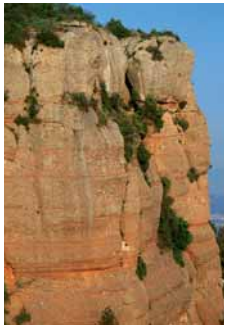
Capçalera del riu Sec a Sant Llorenç del Munt

El riu Sec, límit sud del Parc, és un curs d'aigua intermitent, de cabal escàs, que neix als vessants meridionals del massís de Sant Llorenç del Munt. Té 11 km de longitud i drena els termes de Terrassa, Sant Quirze, Sabadell i Cerdanyola. Poc després de passar pel Masot, les seves aigües arriben al Ripoll. Rius aparentment tranquils, de tant en tant, coincidint amb les pluges de tardor, desperten del seu estat letàrgic i demostren la seva força amb importants avingudes.