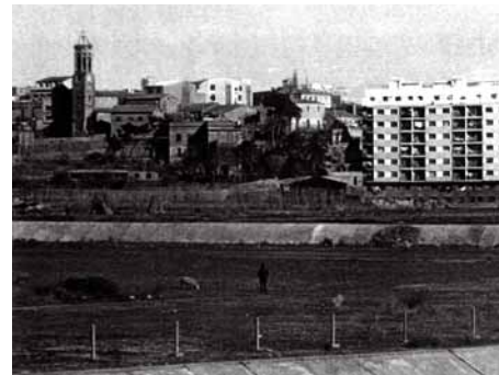
Ripollet des del Masot, 1970

Fins als anys 70, en què es va fer l'autopista i la carretera de Cerdanyola a Ripollet, les terres dels parcs del Masot i de Maria Regordosa eren una única peça de conreu, a tocar dels 2 rius. Probablement, aquest emplaçament peculiar, entre 2 rius i 3 carreteres, les ha salvat d'una major ocupació urbana. A principis de la dècada dels 80 es van construir els jardins de Maria Regordosa (de gestió municipal) i a finals, el parc del Masot, que forma part de la Xarxa Metropolitana. Avui els àlbers i pollancre del Parc, al costat del riu Sec, són un discret record de les esplèndides cintes de vegetació de ribera, que en altre temps festonejaven el seu curs.