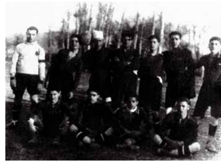
El Club de Futbol Ripollet al camp del Masot, 1921

Si avui és la petanca l'esport més practicat al Masot, fa més de 80 anys, el Club de Futbol Ripollet va triar aquest indret per al seu primer camp. Hi van jugar entre 1921 i 1932, quan en una important final amb el Terrassa, un espectador va llençar un paraigua contra el cap de l'àrbitre. La sanció va ser tan important que l'equip va haver de traspasar els jugadors i es va tancar el camp. Van tornar a jugar el 1933, en un camp a la Rambla.