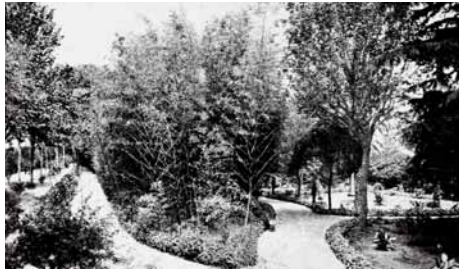
Els jardins de Can Solei a principis del segle xx

"En esta tarde, doctor Josep Cases i jo [...], hem anat a passejar cap a la torre del doctor Romà, advocat, intitulada lo mas Solei; casa i jardins ab horta, vinyes i molta aigua [...], un gran safareig ab canyos d'aigua corrent, adorns de bustos de pedra màrmol, però mutilats de nassos, boques i ulls, i una estàtua del mig del safareig [...]. Hem passejat per aquells caminals rectes, a la manera d'almèdes ab tanta frondositat que hi ha de vinyes, terres de sembradura, tanta còpia d'aigua que, ab aquella lontananza de muntanyes conreades, caseria i mar, són objectes moltíssim deleitables a la vista. I tant han agradat al doctor Cases, que ha donat el nom, a tot aquell ameno jardí i hort, ab aquell gran safareig i aigua corrent, de Paradisus Voluptatis [...]."