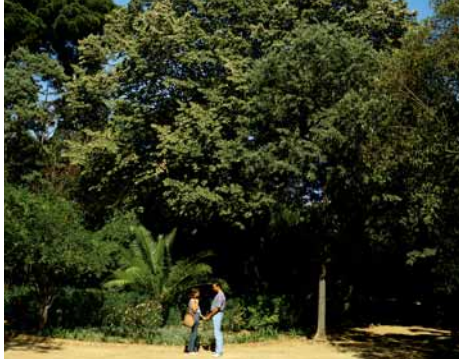
Un dels grans til·lers del Parc

rents racons del Parc, a voltes fent grupets de formes curioses, trobem una altra espècie que crida l'atenció a causa del seu exotisme. Es tracta del còcul , un arbre perennifoli procedent dels boscos del Nepal, d'aspecte elegant i vigorós. Es pot identificar fàcilment pels troncs retorçats i per les fulles d'un verd brillant, allargades i amb tres nervis longitudinals molt visibles.