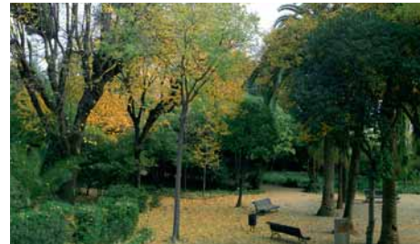
Can Solei a la tardor

Des dels horts del carrer de Sant Bru fins a l'esplanada de la part alta, el Parc s'enfila en terrasses planes que suavitzen els forts desnivells del terreny. Un camí vorejat de vells plàtans, on hi ha els edificis, el divideix clarament en dos sectors: a dalt, una gran esplanada per a activitats de lleure i a baix, amagats sota les densas capçades, els jardins històrics.