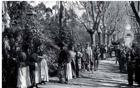
Els badalonins podien entrar als jardins en diades especials