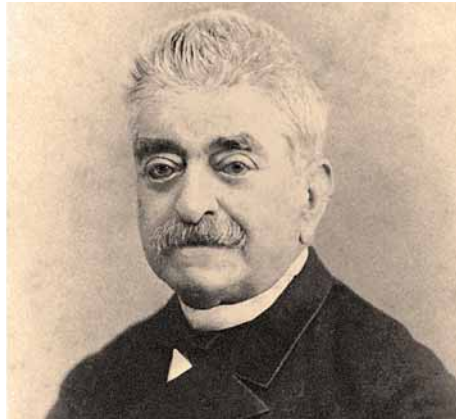
Evarist Arnús, 1887

Elisis, i on va promoure iniciatives cíviqes com l'Exposició Universal. També assolí una bona parcel·la de poder polític: va ser senador, primer electe i, des del 1887, vitalici. Menys coneguda és la seva faceta de filantrop i mecenes, que va desplegar al llarg de la seva vida, tant a Barcelona com a Badalona, ciutat que el 1884 el va nomenar fill adoptiu.