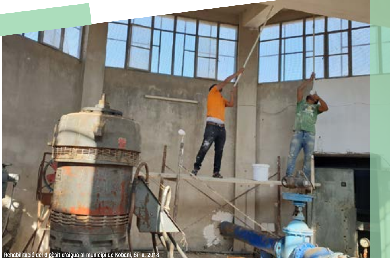
Rehabilitació del dipòsit d'aigua al municipi de Kobani, Síria. 2018

6.2. Desenvolupar estratègies i accions que facilitin una vinculació forta de l'educació per a la ciutadania global amb els projectes que s'implementen i els objectius del Pla director per tal d'enfortir la visió local i global.