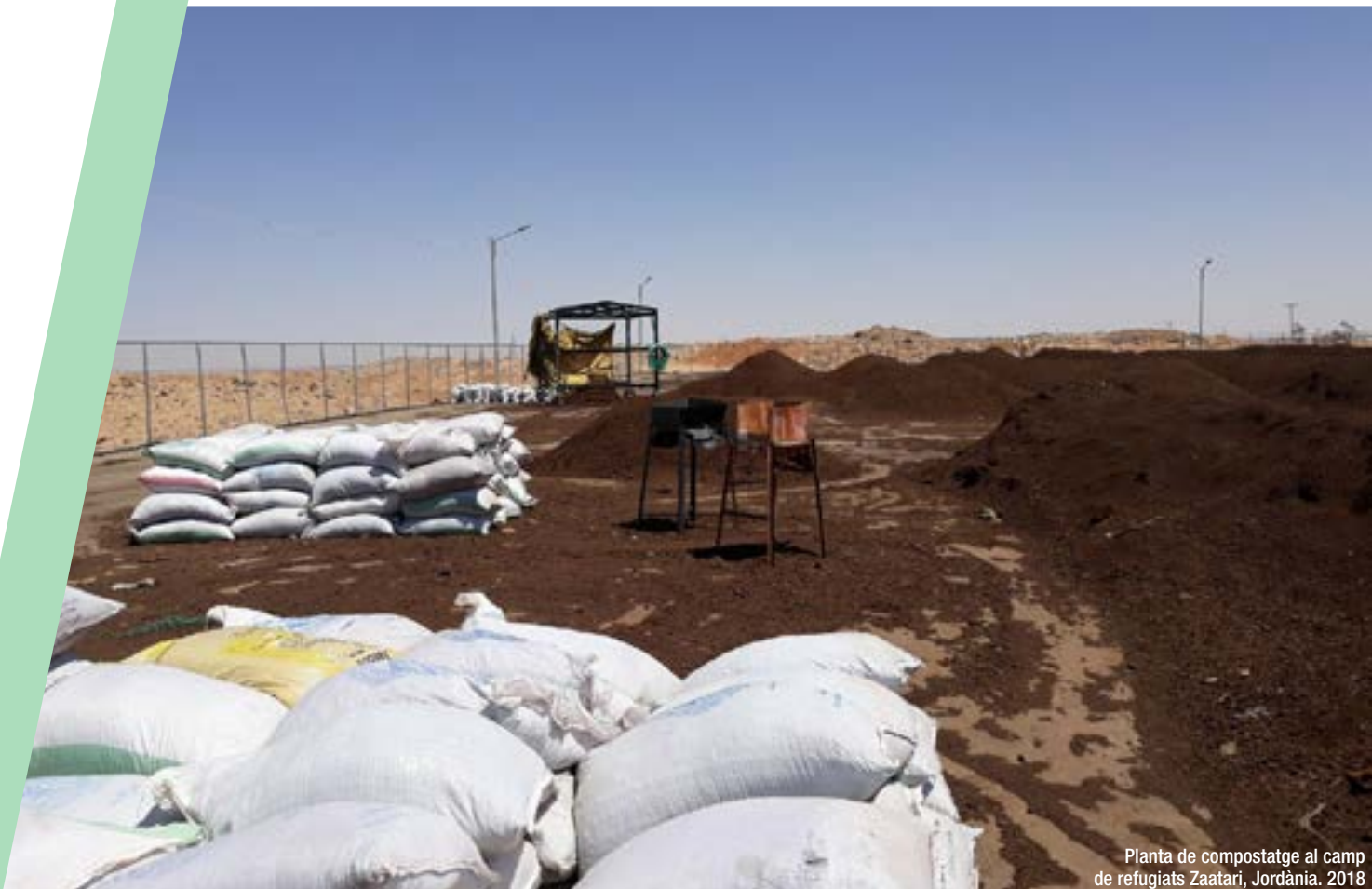
Planta de compostatge al camp de refugiats Zaatari, Jordània. 2018