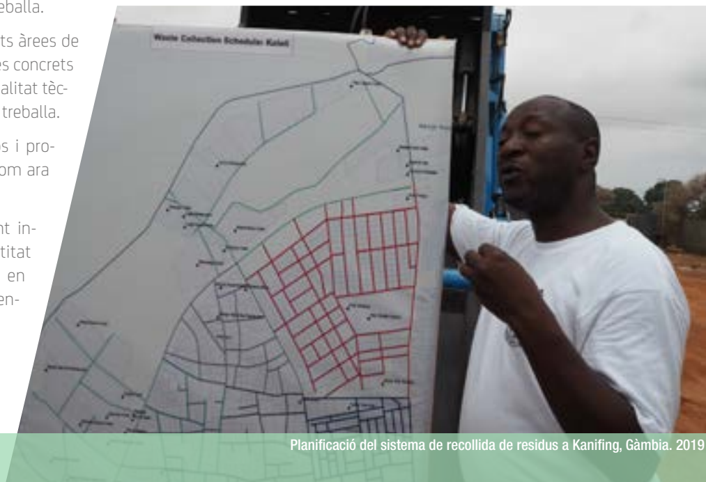
Planificació del sistema de recollida de residus a Kanifing, Gàmbia. 2019