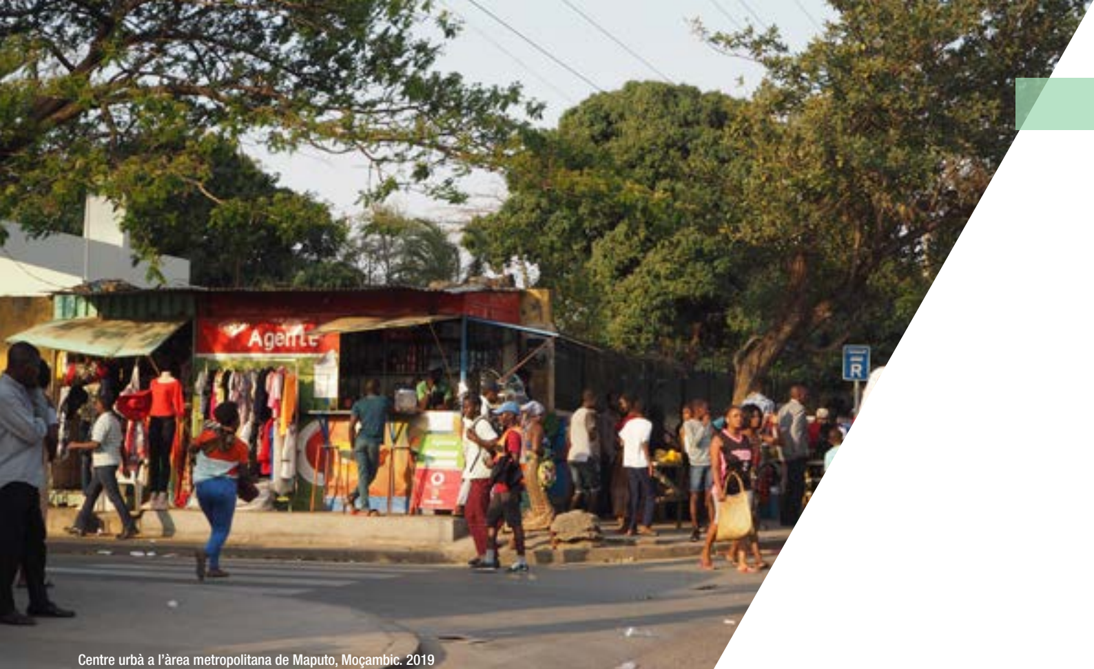
Centre urbà a l'àrea metropolitana de Maputo, Moçambic. 2019