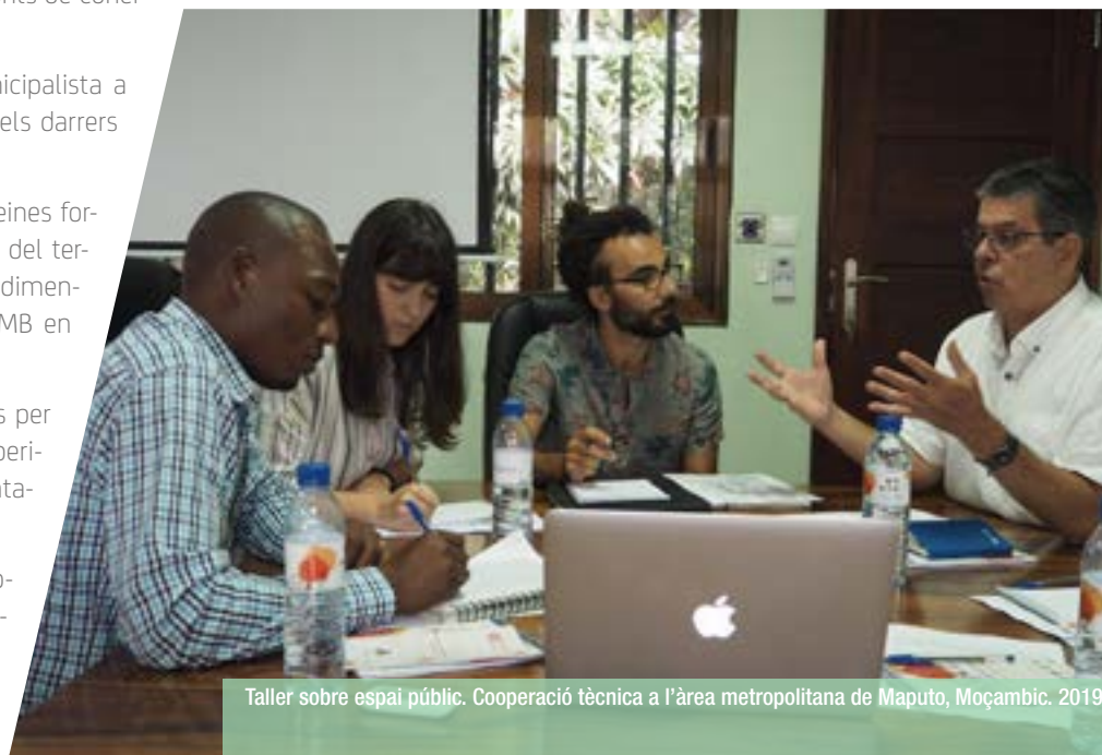
Taller sobre espai públic. Cooperació tècnica a l'àrea metropolitana de Maputo, Moçambic. 2019