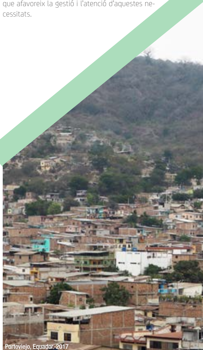
Portoviejo, Equador. 2017

postes a mitjà o llarg termini: s'han de centrar en el present. El suport de l'AMB es fa imprescindible per respondre a aquesta situació, amb una mirada supramunicipal que afavoreix la gestió i l'atenció d'aquestes necessitats.