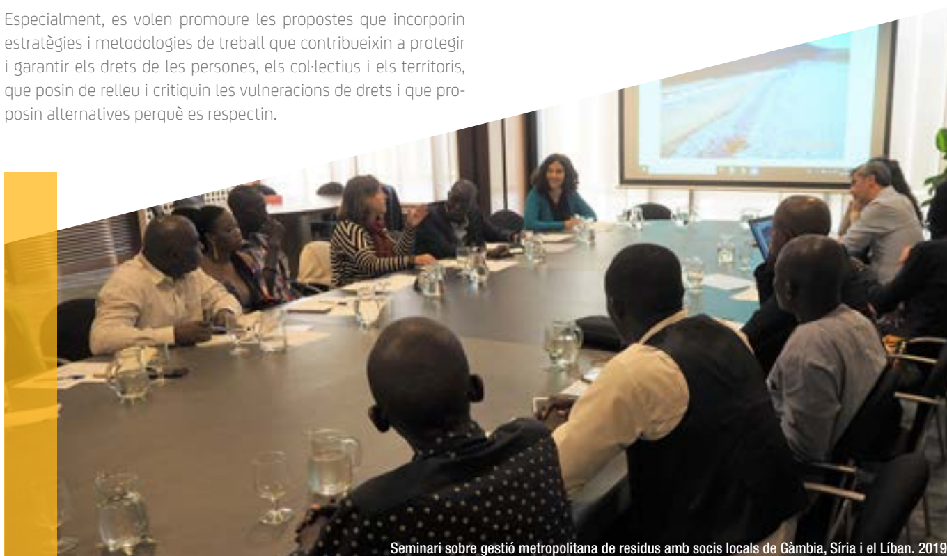
Seminari sobre gestió metropolitana de residus amb socis locals de Gàmbia, Síria i el Líban. 2019

Per al desenvolupament de polítiques públiques i la gestió de les àrees urbanes extenses i les metròpolis, cal articular les eines jurídiques i administratives adequades als diversos col·lectius i preveure mecanismes que permetin fer una gestió amb la participació activa de la ciutadania.