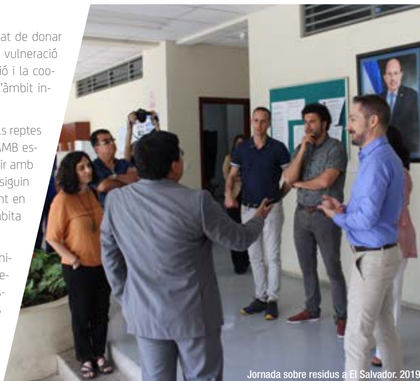
Jornada sobre residus a El Salvador. 2019