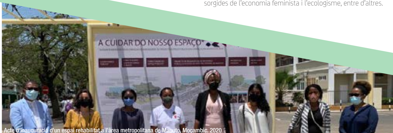
Acte d'inauguració d'un espai rehabilitat a l'àrea metropolitana de Maputo, Moçambic. 2020

I amb una visió crítica, també es poden tenir en compte altres posicions i aproximacions a les agendes, la cooperació i els drets humans, com ara el decreixement i el «bon viure», o les reflexions sorgides de l'economia feminista i l'ecologisme, entre d'altres.