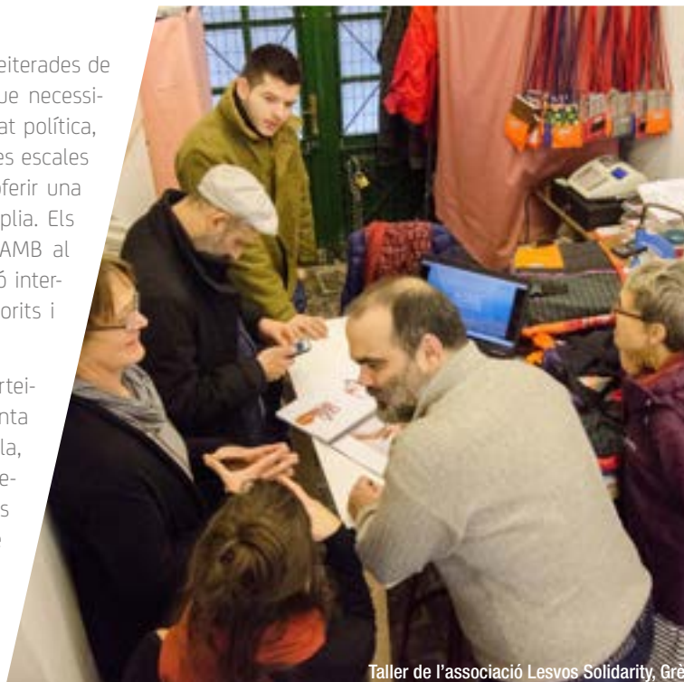
Taller de l'associació Lesvos Solidarity, Grècia. 2019