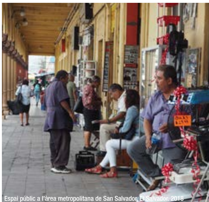
Espai públic a l'àrea metropolitana de San Salvador, El Salvador. 2018

Per tal de fer-ho possible, és essencial que els governs locals tinguin en compte la diversitat i apostin per la inclusió de totes les persones que conviuen a la metròpolis. Això també implica incorporar el dret a la ciutat com un referent clau en les polítiques metropolitanes. Quan la diversitat s'inclouï en la contextualització urbana, es podrà fer l'anàlisi i la consegüent transformació de les causes estructurals que impedeixen que es respectin els drets humans, és a dir, es podran transformar les actuacions metropolitanes que reforcen la desigualtat, l'exclusió i la discriminació.