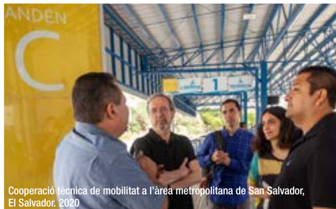
Cooperació tècnica de mobilitat a l'àrea metropolitana de San Salvador, El Salvador. 2020

El repte a què s'enfronten els responsables polítics i les institucions competents és la capacitat de promoure i construir entorns urbans que garanteixin els drets de les persones i una vida justa i equitativa. No és una tasca d'un únic nivell, ni d'un sol departament, sinó que obliga a mantenir una coordinació eficaç i eficient que posi el focus en la transformació d'aquests entorns mitjançant l'accés als béns públics, la governança democràtica i la planificació urbana accessible.