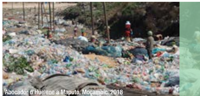
Abocador d'Huelene a Maputo, Moçambic. 2018

L'estat d'emergència climàtica no entén de fronteres ni de límits administratius i els seus efectes arriben arreu. Per fer-hi front es requereixen accions globals i decidides, així com el compromís de tots els actors (administracions a tots els nivells, empreses, sindicats, món acadèmic i de recerca i organitzacions socials) per oferir solucions clares i donar totes les respostes necessàries. A la vegada, cal dur a terme accions per encarar els canvis que ja són aquí, com també els que vindran en un futur pròxim.