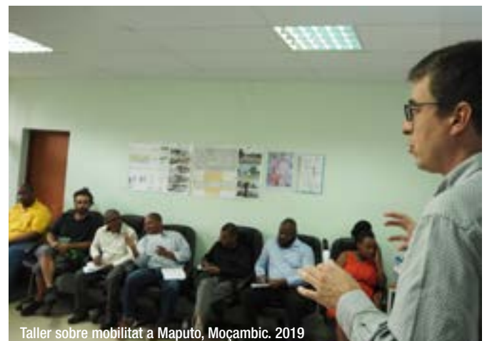
Taller sobre mobilitat a Maputo, Moçambic. 2019