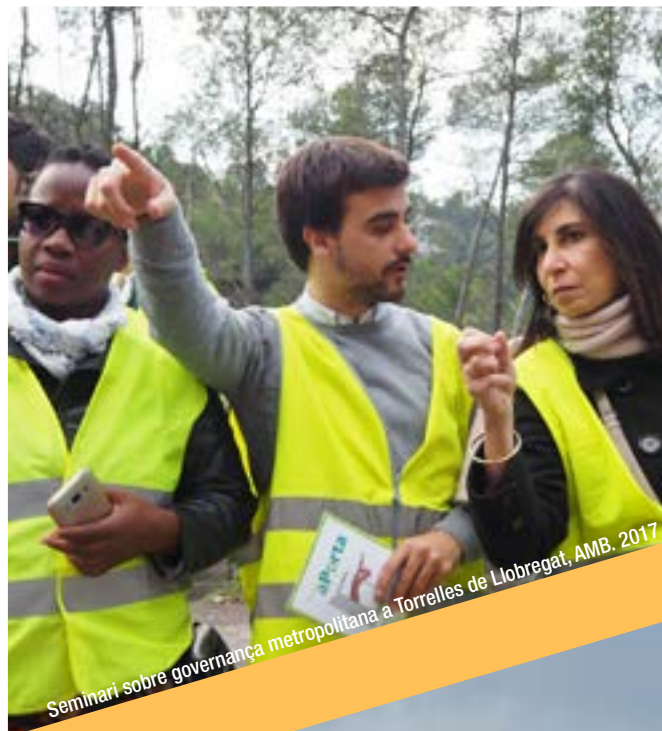
Seminari sobre governança metropolitana a Torrelles de Llobregat, AMB. 2017

Aquests principis que aporten una mirada i una pràctica integradores s'han de veure reflectits de manera transversal i s'han d'incloure sempre per tal de poder fer una lectura complexa de la realitat i establir les estratègies adequades per donar resposta a tots els col·lectius, especialment els més invisibilitzats.