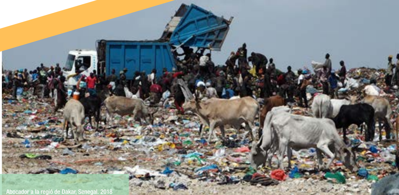
Abocador a la regió de Dakar, Senegal. 2018