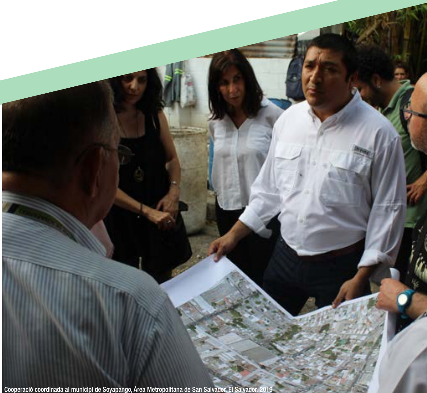
Cooperació coordinada al municipi de Soyapango, Àrea Metropolitana de San Salvador, El Salvador. 2019