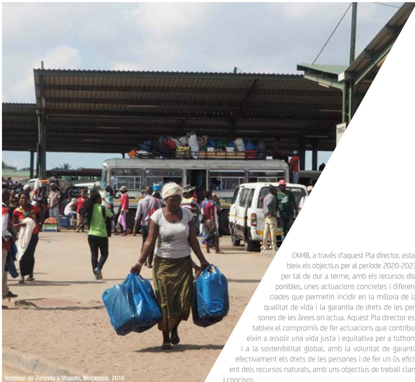
Terminal de Zimpeto a Maputo, Moçambic. 2018

L'AMB, a través d'aquest Pla director, estableix els objectius per al període 2020-2023 per tal de dur a terme, amb els recursos disponibles, unes actuacions concretes i diferenciades que permetin incidir en la millora de la qualitat de vida i la garantia de drets de les persones de les àrees on actua. Aquest Pla director estableix el compromís de fer actuacions que contribueixin a assolir una vida justa i equitativa per a tothom i a la sostenibilitat global, amb la voluntat de garantir efectivament els drets de les persones i de fer un ús eficient dels recursos naturals, amb uns objectius de treball clars i concisos.