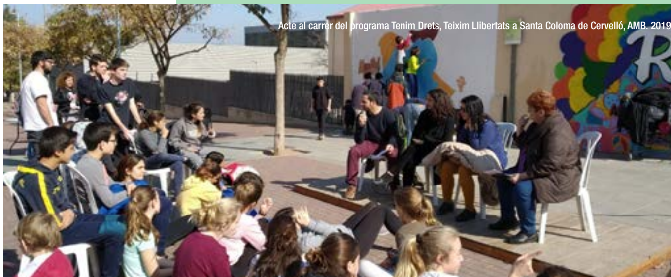
Acte al carrer del programa Tenim Drets, Teixim Llibertats a Santa Coloma de Cervelló, AMB. 2019

Convé ressaltar la necessitat de no deixar d'aprofundir en el coneixement d'aquestes desigualtats per generar noves eines polítiques, socials i tècniques que permetin encarar-les amb més força.