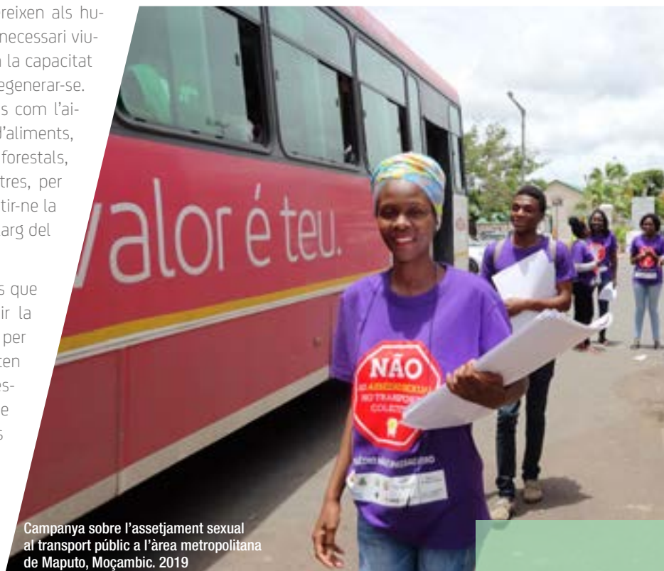
Campanya sobre l'assetjament sexual al transport públic a l'àrea metropolitana de Maputo, Moçambic. 2019

Les societats són diverses i les persones que les conformen expressen aquesta diversitat de múltiples maneres. La diversitat és una font de riquesa i permet obtenir visions àmplies i solucions variades als reptes socials. Els mecanismes que incorporen la diversitat en els projectes, a partir d'una anàlisi d'interseccionalitat, permeten visibilitzar els diversos col·lectius implicats en els projectes, les visions que integren, les necessitats i les respostes que hi aporten, i així construir solucions més resilientes. D'aquesta manera, es poden cercar les propostes més adequades per contribuir a la justícia i a l'equitat i consolidar-les al llarg del temps. La construcció col·lectiva de les àrees urbanes ha de permetre configurar societats justes i equitatives i, per això, cal treballar amb persones de diferents generacions, nivell socioeconòmic o base cultural, entre d'altres.