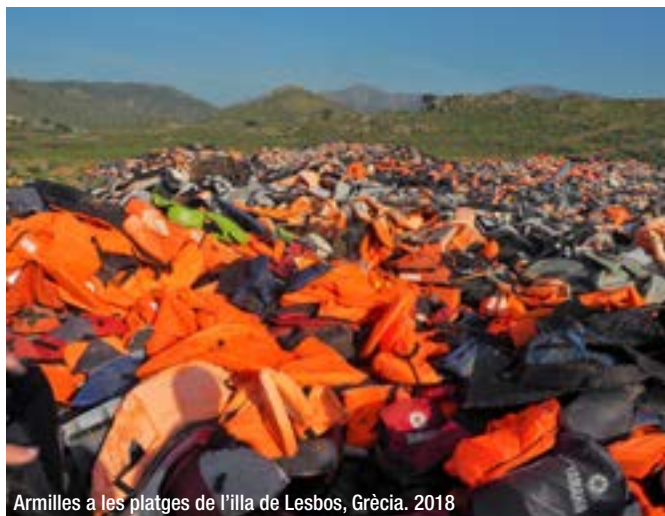
Armelles a les platges de l'illa de Lesbos, Grècia. 2018

És necessari salvaguardar les accions de millora posant l'accent en la defensa dels drets de les persones i de les societats més desafavorides, perquè també es beneficiïn dels avenços. Alhora, cal reforçar la idea que les actituds i els hàbits arreu del planeta poden impactar en zones molt allunyades i incrementar les desigualtats locals.