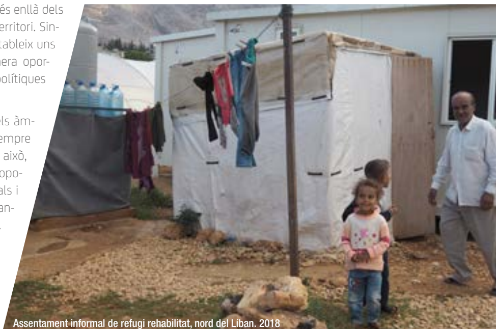
Assentament informal de refugi rehabilitat, nord del Líban. 2018

La diversitat i la complexitat de les zones urbanes, especialment de les àrees metropolitanes, poden afavorir que determinats col·lectius o persones quedin exclòs i no disposin de les vies necessàries per intervenir i participar en les qüestions que afecten el seu dia a dia. Les metròpolis han de vetllar per mantenir una mirada global sobre el territori, que situï totes les persones al centre, en preservar els drets i els permeti viure amb justícia i equitat.