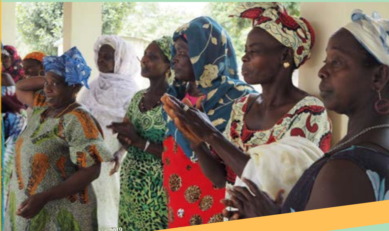
Taller de compostatge a Tujereng, Gàmbia, 2019