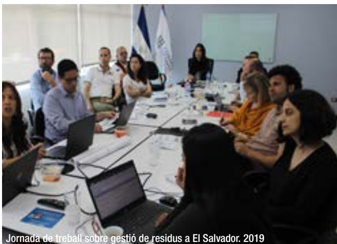
Jornada de treball sobre gestió de residus a El Salvador. 2019

Els ajuntaments dels municipis que formen l'AMB tenen propostes pròpies de cooperació internacional, amb prioritats específiques i recursos disponibles. L'AMB estableix una cooperació coordinada amb els ajuntaments, que s'adapta a les necessitats de cada cas, i es fa una feina conjunta per tal de sumar i complementar i es facilita el treball en xarxa entre ajuntaments, amb una mirada metropolitana. Les dues grans línies d'actuació són la cooperació coordinada i l'educació per a la ciutadania global en xarxa.