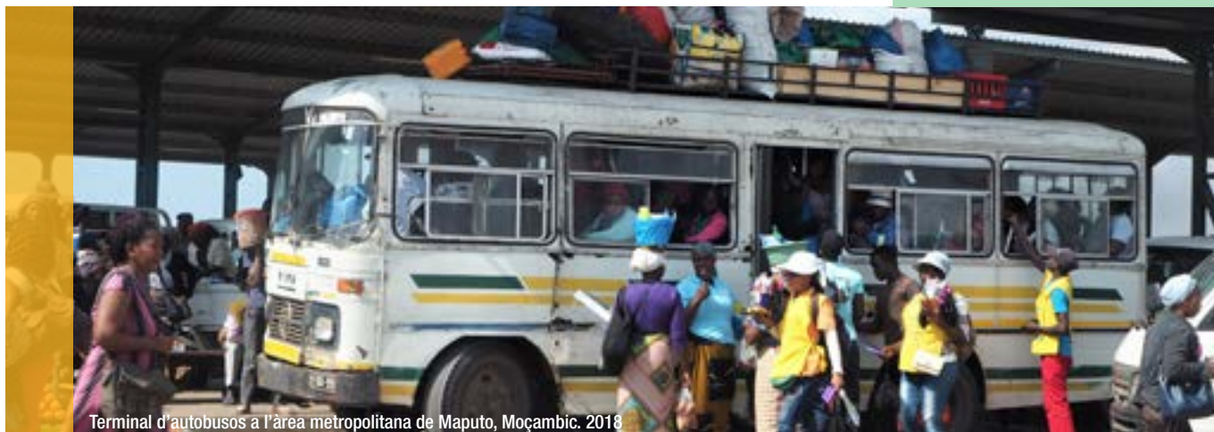
Terminal d'autobusos a l'àrea metropolitana de Maputo, Moçambic. 2018

La mobilitat ha de preveure modes sostenibles per preservar la salut de les persones i la qualitat de l'entorn natural, ha de tenir en compte les necessitats de tothom i ha d'estar a l'abast de tota la ciutadania. Alhora, cal definir estratègies per controlar i reduir la contaminació i millorar la qualitat de l'aire, un gran repte d'escala metropolitana.