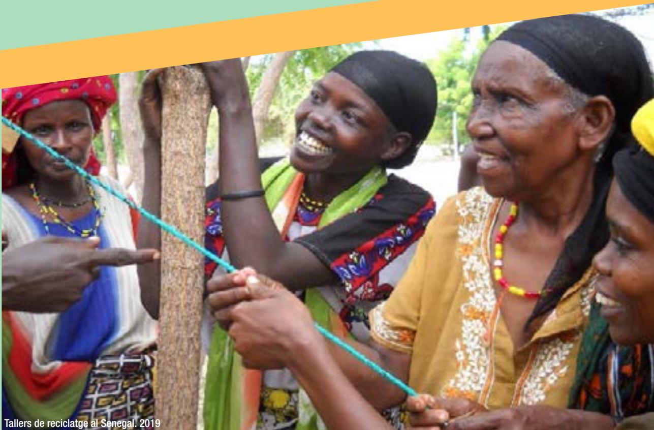
Tallers de reciclatge al Senegal. 2019