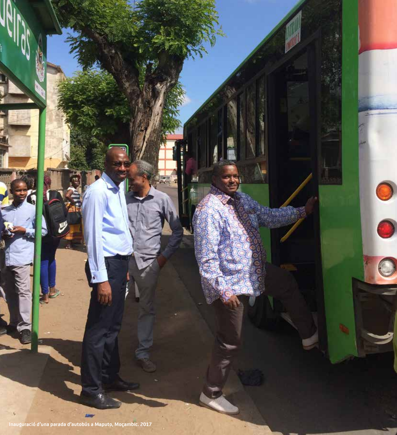
Inauguració d'una parada d'autobús a Maputo, Moçambic. 2017