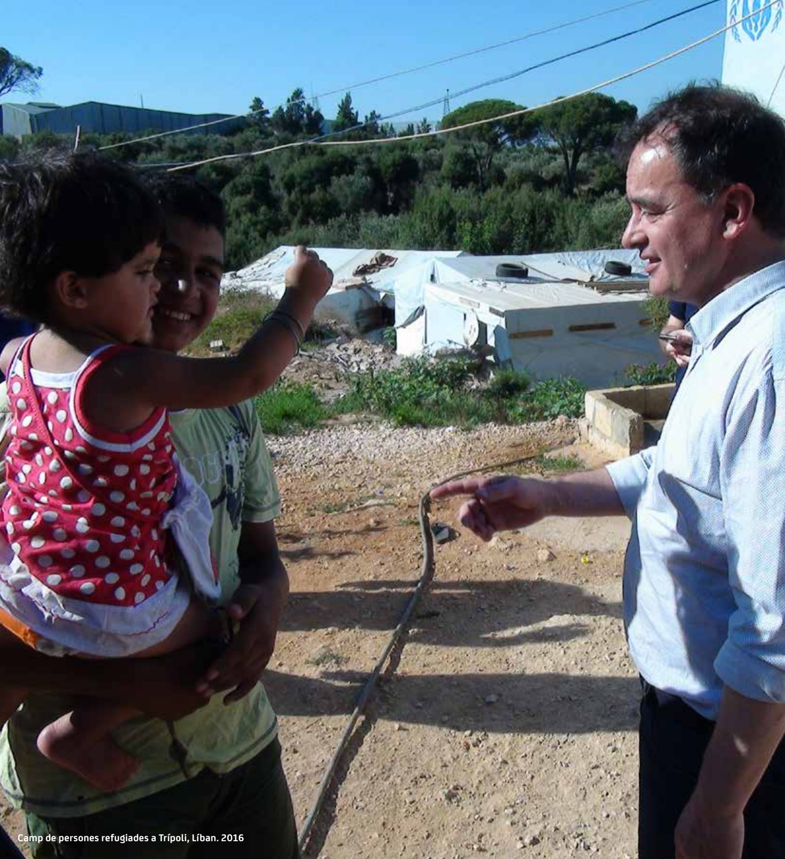
Camp de persones refugiades a Trípoli, Líban. 2016