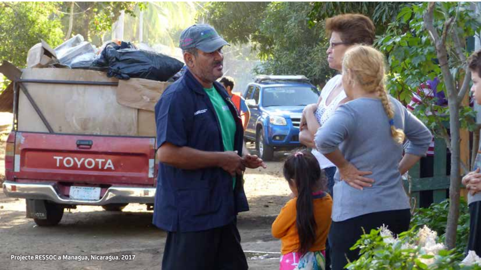
Proyecto RESSOC a Managua, Nicaragua. 2017