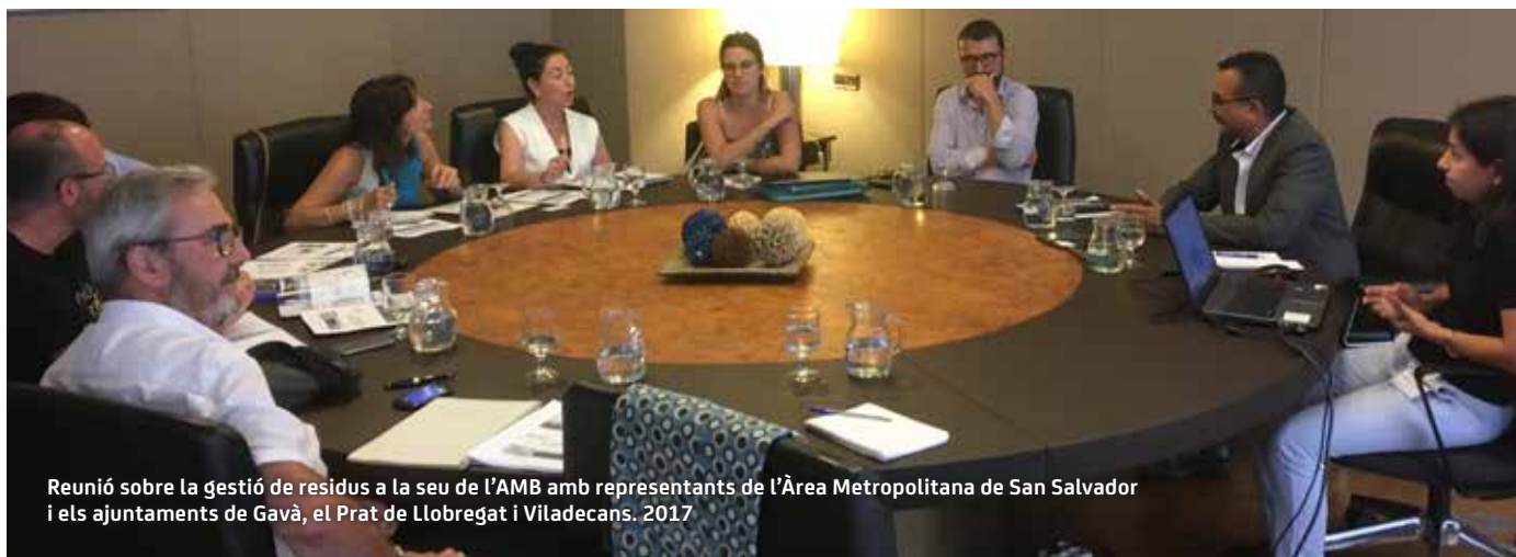
Reunió sobre la gestió de residus a la seu de l'AMB amb representants de l'Àrea Metropolitana de San Salvador i els ajuntaments de Gavà, el Prat de Llobregat i Viladecans. 2017

tacions dels col·lectius més exclusos, per transformar els desequilibris globals i locals, amb la qual cosa les institucions municipals i la societat civil passen a guanyar centralitat en l'agenda global i local.