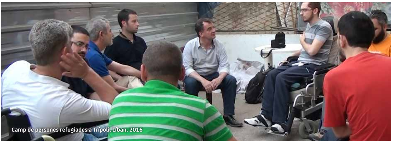
Camp de persones refugiades a Trípoli, Líban. 2016

Cadascun d'aquests sis enfocaments ha de tenir un tractament transversal integrador i ha d'assegurar la inclusió de tots els altres per dur a terme una lectura complexa de la realitat que comporti estratègies adequades a tots els col·lectius, especialment els més invisibilitzats.