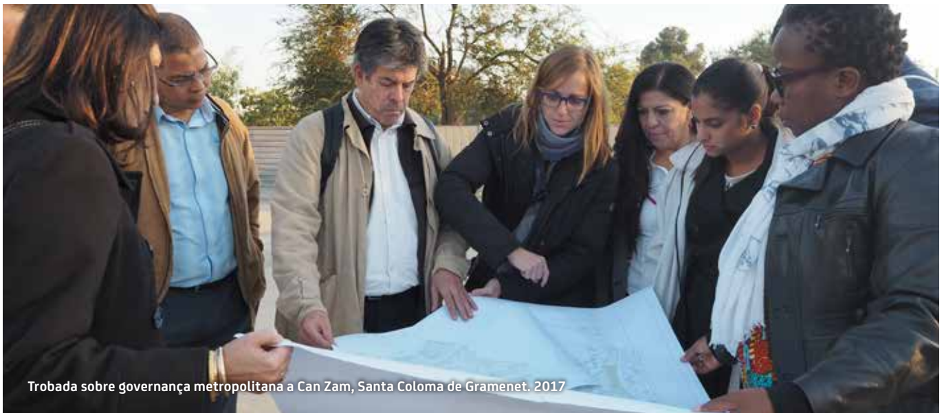
Trobada sobre governança metropolitana a Can Zam, Santa Coloma de Gramenet. 2017