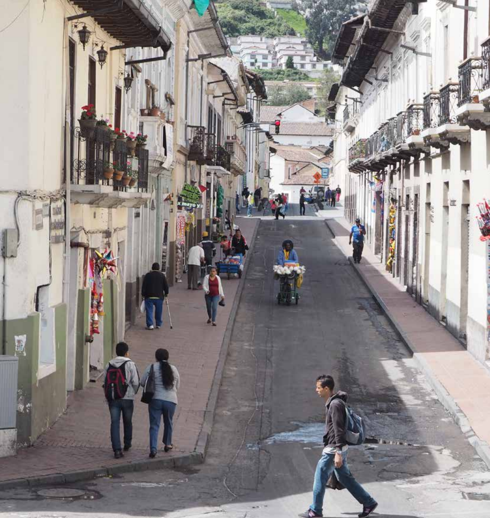
Quito, Ecuador. 2017