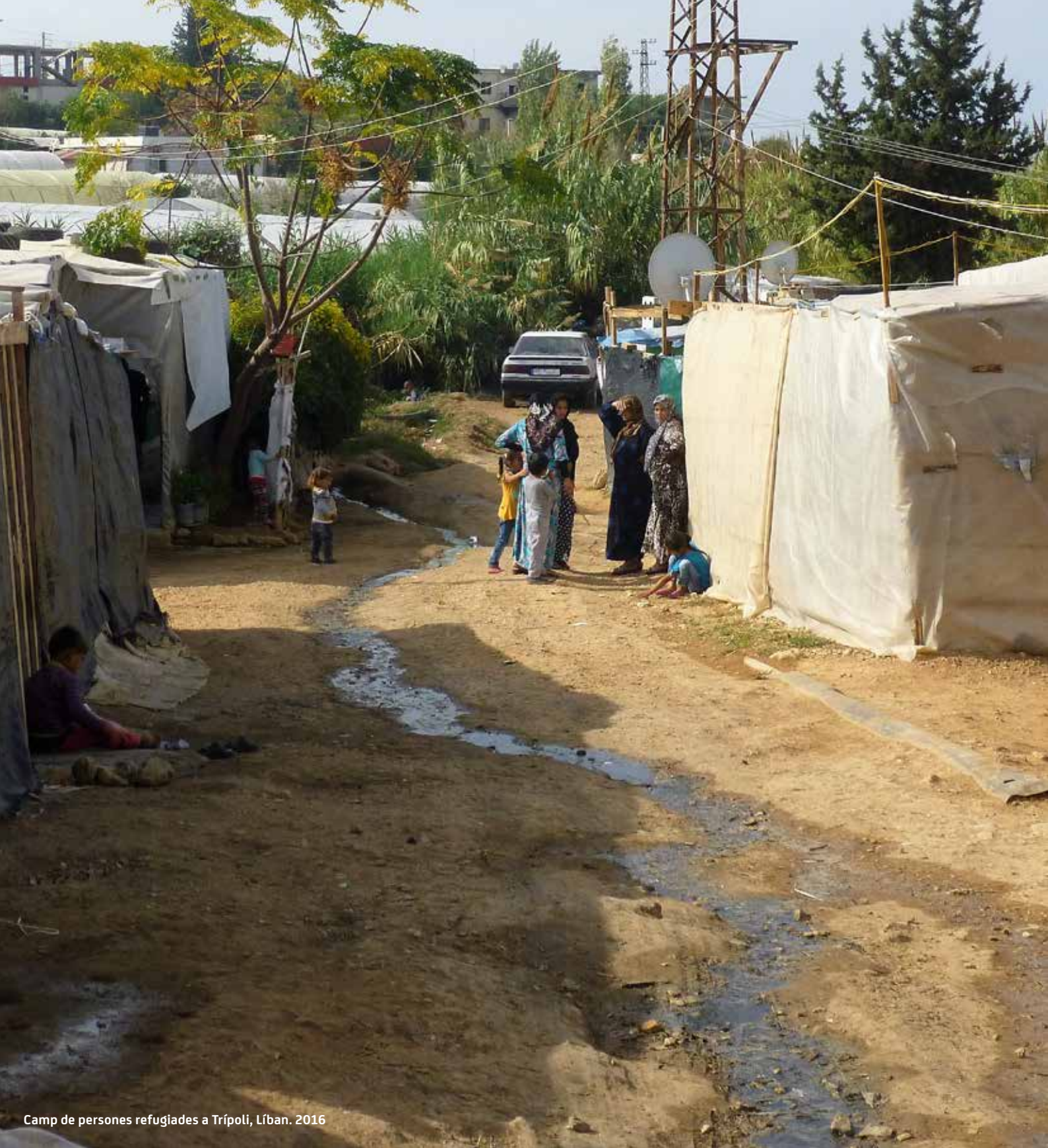
Camp de persones refugiades a Trípoli, Líban. 2016