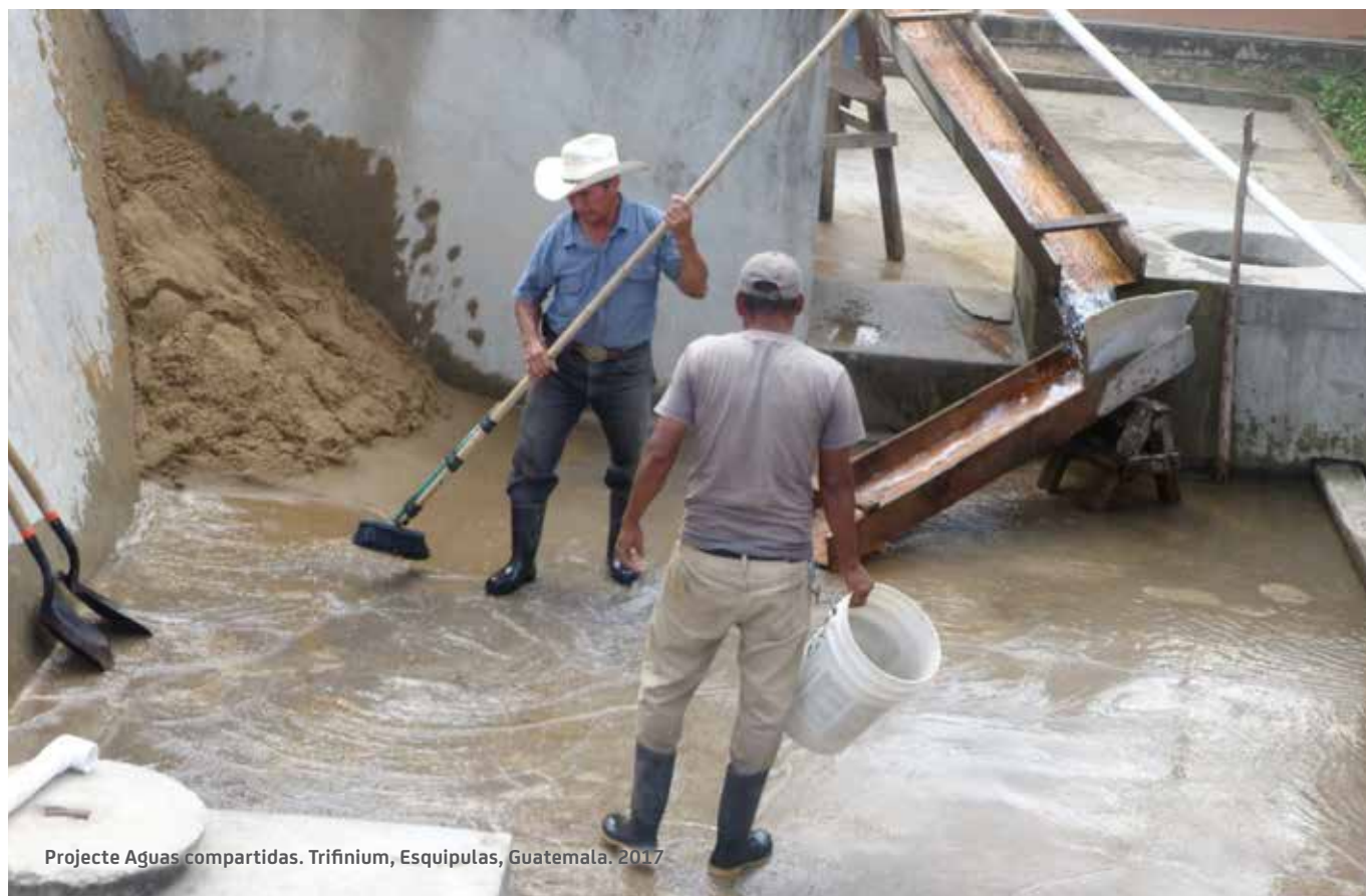
Projecte Aguas compartidas. Trifnium, Esquipulas, Guatemala. 2017

Per donar a conèixer el seguiment de la implementació del Pla director es preveu que es facin servir els canals de comunicació habituals, com el web, el butlletí i notes de premsa, vetllant per la regularitat i la qualitat de la informació. Aquestes vies han de servir per divulgar els projectes i les activitats que es duen a terme dins del marc del Pla director.