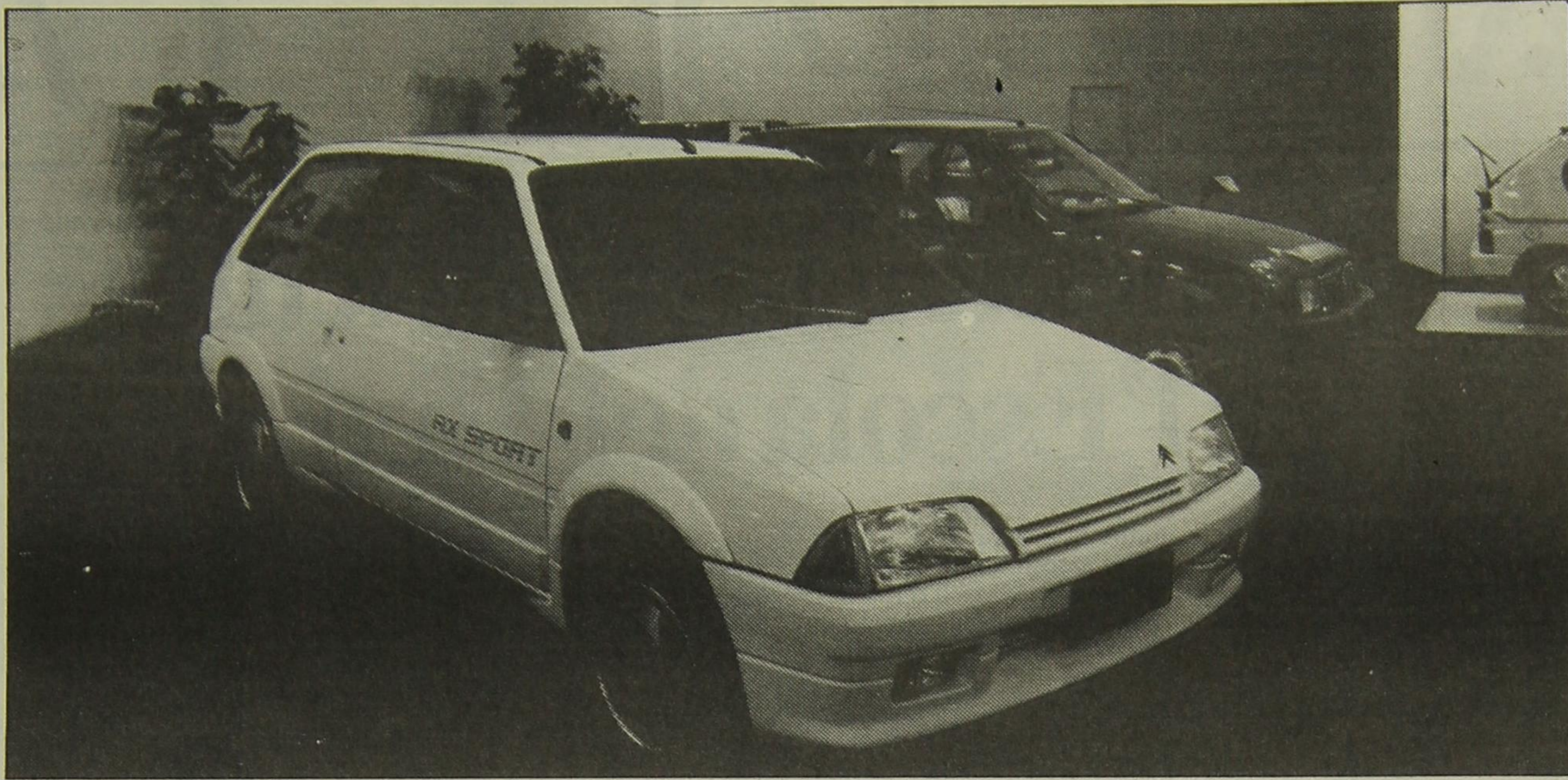
Citroën ha aconseguit triomfar aquest any, amb l'AX, en el segment de petits utilitaris

més juvenil amb la incorporació del color negre al tauler. El model GT augmentarà encara més la línia supereportiva amb els para-xocs