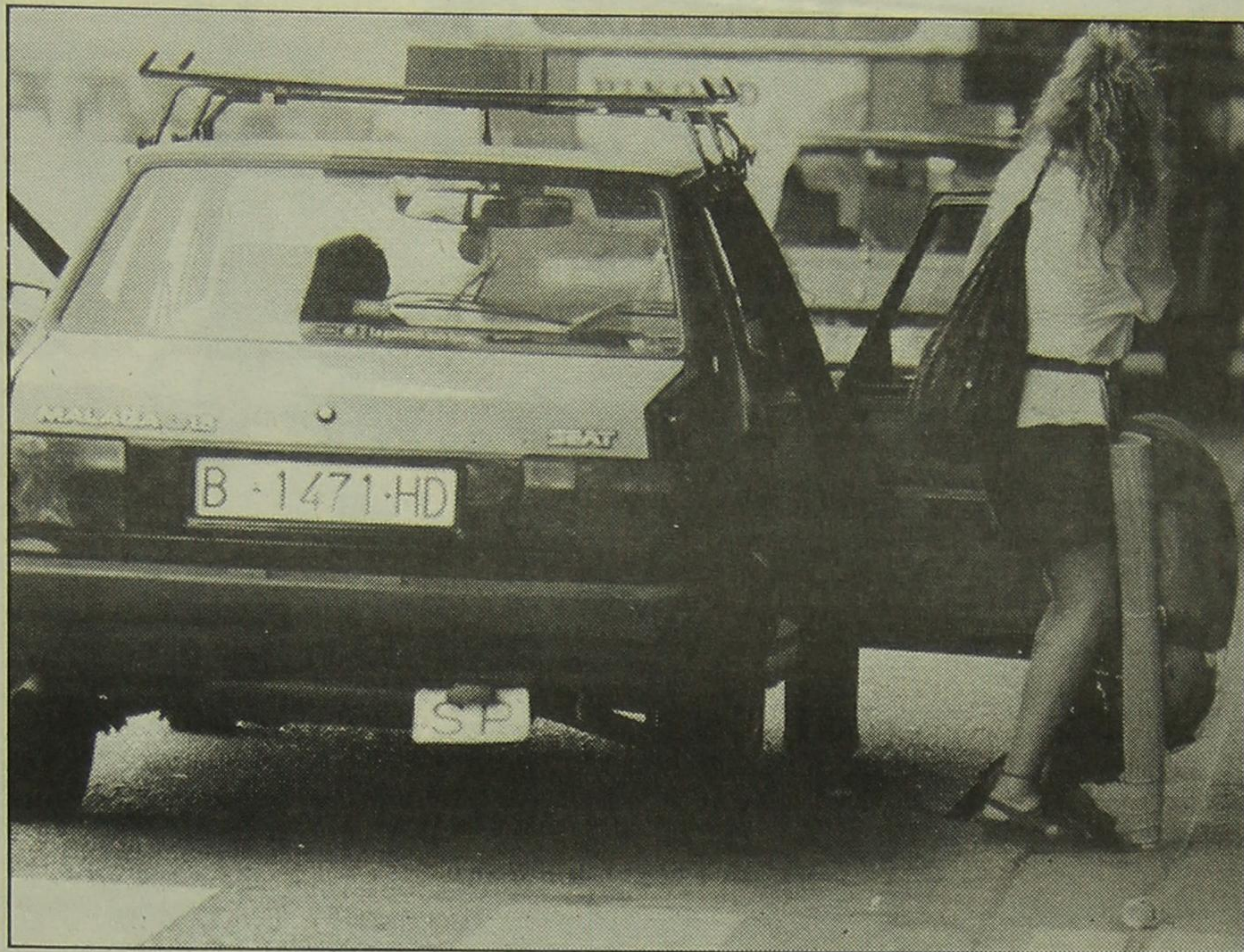
L'usuari pot demanar al taxista que l'ajudi a col·locar correctament l'equipatge

viatgers, embalums, equipatges o animals que portin puguin, de forma manifesta, embrutar o causar danys al vehicle.