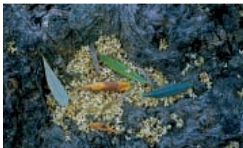
flors damunt l'escorça