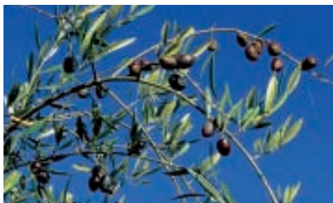
fulles i fruits

L'olivera és un arbret perennifoli, de poca alçada (7-15 m). Té l' escorça llisa quan és jove, però amb el pas del temps es va enfosquint, engruixint, capgirant, esquerdant...donant lloc a uns troncs vells i torturats, que l'empremta dels segles ha transformat en singulars escultures vivents. Les branques són esteses i flexibles i la capçada pot ser ampla i estesa, o arrodonida. Les fulles oposades, el·líptiques i punxegudes tenen el pecíol molt curt i el marge recorbats cap ensota; són verd grisenques per sobre i piloses, argentades i brillants amb la llum del sol pel revers. Tenen flors blanques, petites i agrupades formant ramells drets, que esclaten entre maig i juny. El fruit és l'oliva, una drupa oval de color verd, que es torna negra quan madura, a finals de tardor.