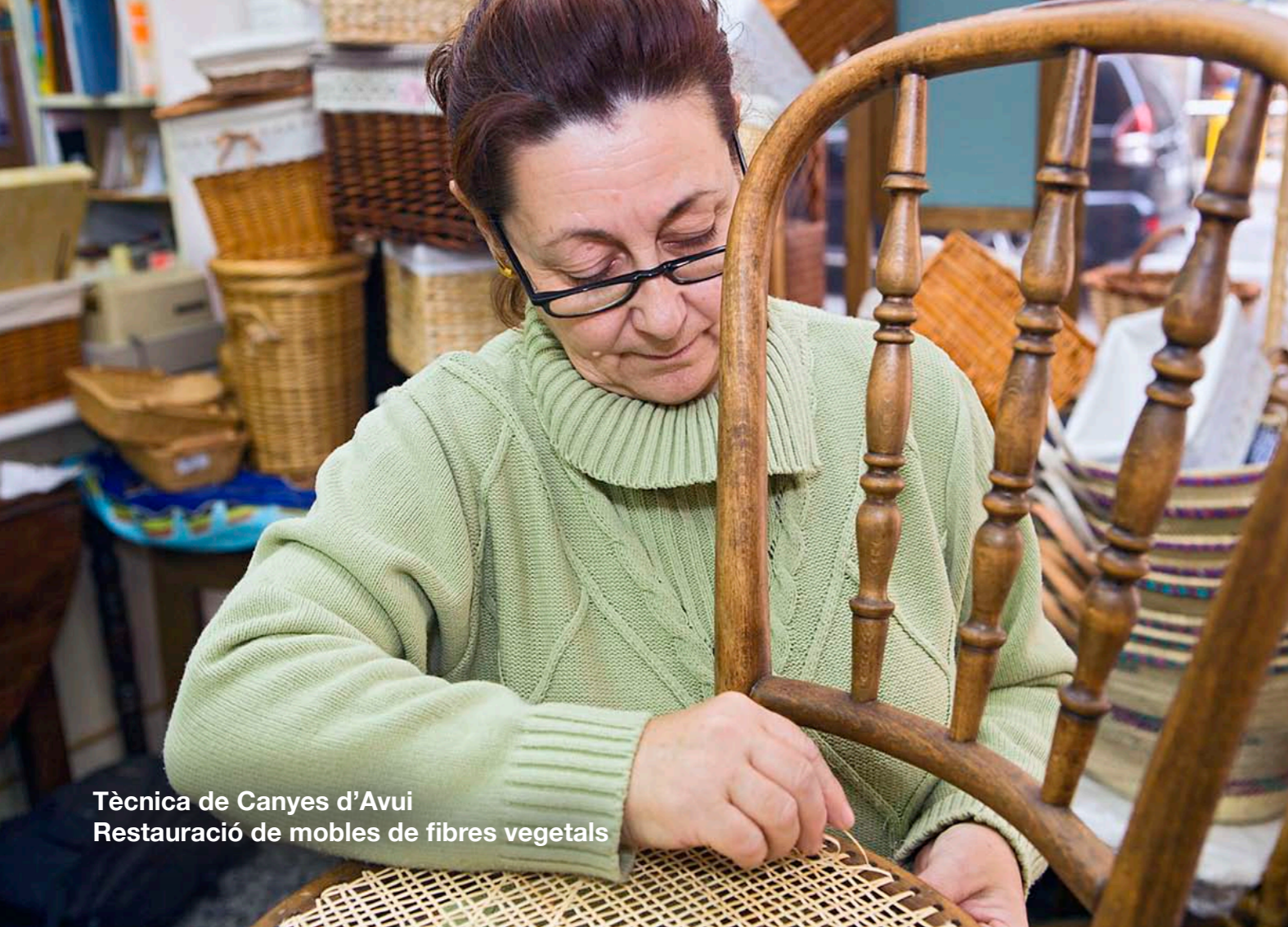
Tècnica de Canyes d'Avui Restauració de mobles de fibres vegetals

Pel que fa al mobiliari , cal diferenciar entre la senzilla reparació d'un fons de calaix o una pota d'un armari i la restauració, molt més complexa, d'un moble antic. Dins aquesta categoria genèrica hi incloem els tapissers i els establiments que treballen amb fibres vegetals com canya, boga, vímet o corda, que cada cop més buscats per l'escassetat de professionals en aquest àmbit.