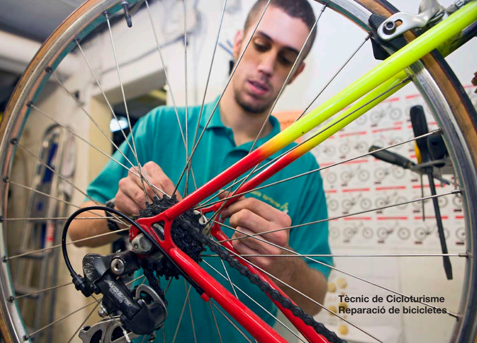
Tècnic de Cicloturisme Reparació de bicicletes