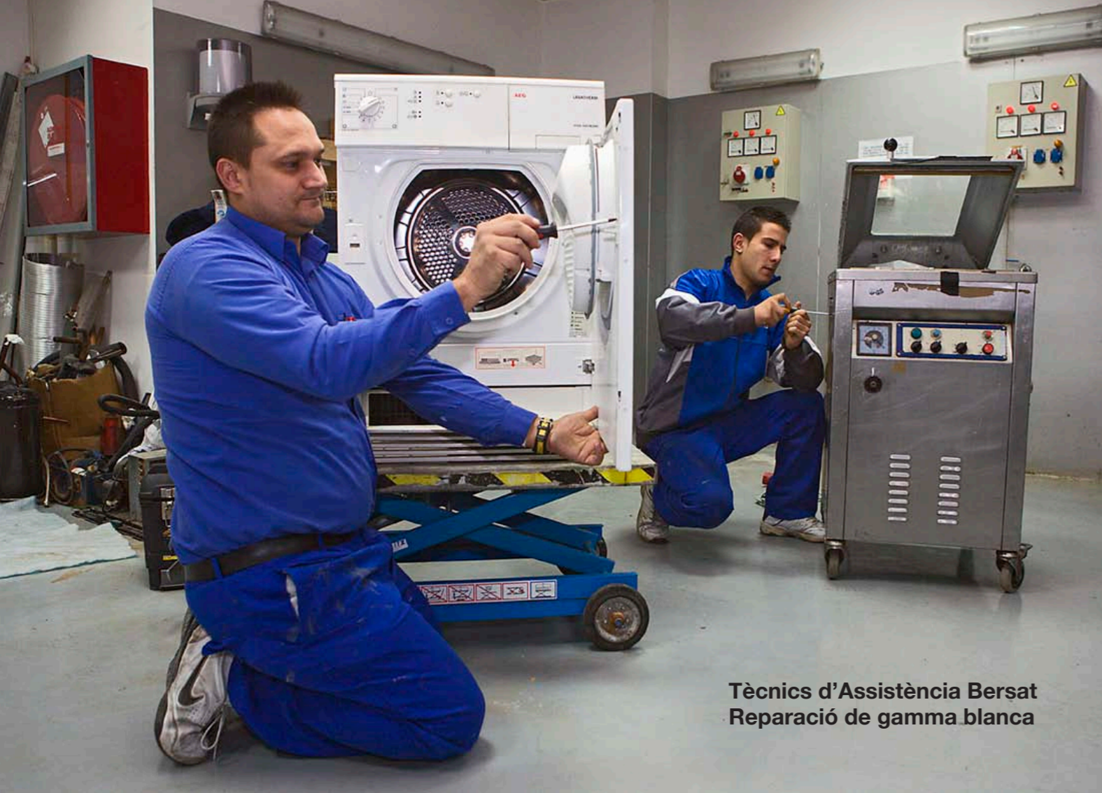
Tècnics d'Assistència Bersat Reparació de gamma blanca

Com a reparadors de gamma blanca , us podeu adreçar a: I com a reparadors de petits aparells elèctrics , trobeu: