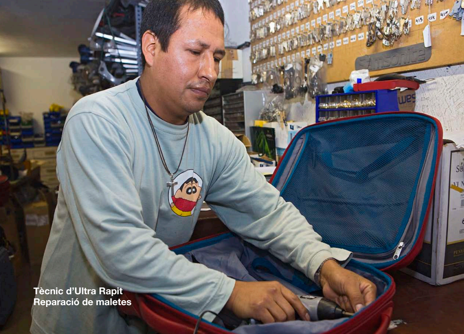
Tècnic d'Ultra Rapit Reparació de maletes