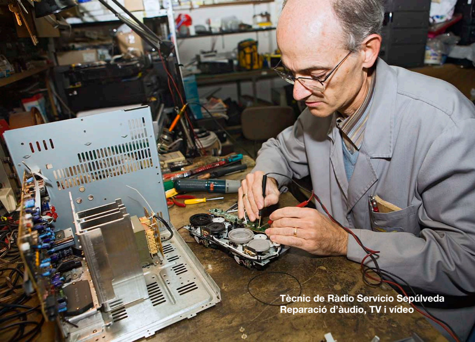
Tècnic de Ràdio Servicio Sepúlveda Reparació d'àudio, TV i vídeo

Les reparacions amb més demanda són les referents a electrodomèstics i mobiliari.