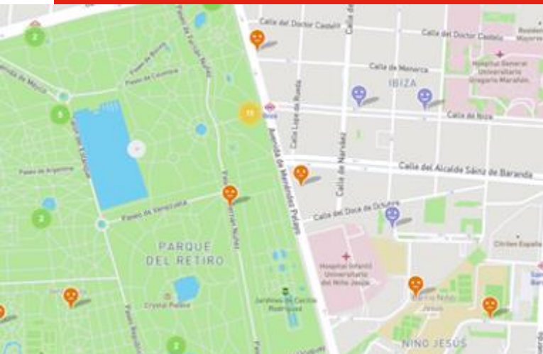
A section of Plan International's interactive map of Madrid: each sad face represents a reported bad encounter for a woman

L'organització Plan Internacional ha creat Free to Be , un projecte online on les dones poden reportar en un mapa agressions físiques, verbals o psicològiques per part de persones desconegudes. La iniciativa va néixer a la ciutat de Melbourne i es va replicar el projecte a ciutats com Lima, Delhi, Sydney i Madrid . A primers d'agost es va tancar el procés de recollida de dades i actualment Plan Internacional, en col·laboració amb Monash University (Melbourne), treballa en un informe que es publicarà el proper octubre: a Madrid hi han participat 2.400 dones , de les quals el 74% reporta haver estat assetjada.