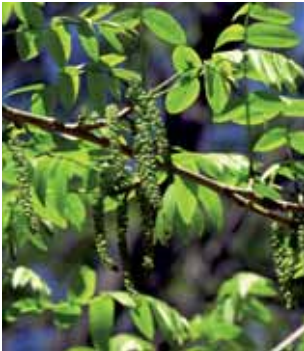
fulles i flors masculines

La noguera alada de Rehder és un híbrid caducifoli de grans dimensions, molt bonic pel seu port, per la seva coloració tardoral amb tonalitats que van del groc al marró i pels decoratius penjolls que formen flors i fruits. Acostuma a fer una capçada ampla a partir d'un tronc principal dret amb branques esteses. Té l' escorça solcada i de color marró granatós. Les fulles , compostes i de color verd fosc, broten tard, entre l'abril i el maig; fan de 20 a 45 cm de longitud, estan lleugerament perfumades i tenen d'11 a 20 foliols, arrodonits a la base i amb el marge dentat. A l'estiu surten les flors , masculines i femenines sobre un mateix arbre, s'agrupen en llargs aments de color verd clar, molt decoratius, que donen a l'arbre un aspecte peculiar i delicat, com si s'omplís de petites cortinetes bellugadisses. El fruits són alats, formen raïms de 20-45 cm de longitud i resten a l'arbre durant l'hivern.