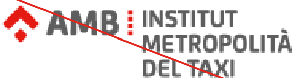
Aplicació amb una resolució incorrecta