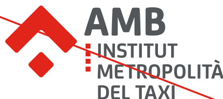
Ús incorrecte de les proporcions i disposició