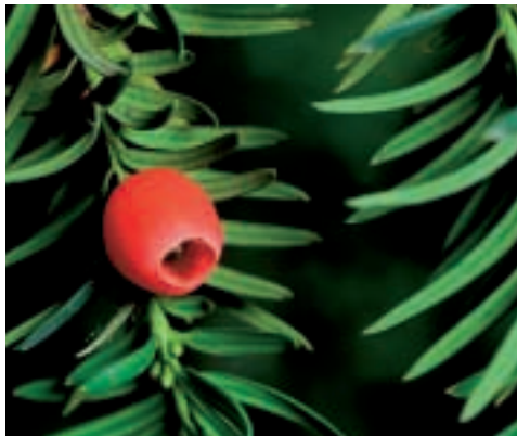
detall fulles i aril