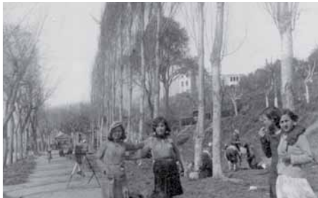
El Molinet, amb la Torre Roja al fons, cap a 1920-1925