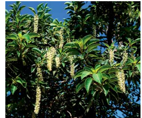
Fulles i flors de bellaombra

Les bellaombres , originàries de Sud-amèrica, es reconeixen fàcilment pel gran engruiximent de la soca i les arrels que sobresurten del terra i arrenquen voreres i paviments. Nombroses branques formen una capçada protectora que ofereix una ombra densa i refrescant: d'aquí el seu nom. Les fulles són ovalades i les flors, uns bonics penjolls blancs, es transformen a l'estiu en petits fruits agrupats en raïms. Viuen molts anys i malgrat que el seu aspecte sembla indicar el contrari, la fusta es trenca fàcilment i no serveix ni per a llenya.