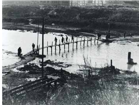
El pas del riu

El riu ha estat sempre una forta barrera per a la comunicació dels pobles d'ambdós marges. Els seus habitants, al llarg del temps, han anat utilitzant diferents enginys per salvar aquest obstacle. Els antics passa rius (homes que passaven la gent a col·libè), els guals, les passarel·les de taulons (en algunes de les quals es cobrava el dret de pontatge o dret de pas) i els ponts de fusta, foren fins al 1915, en què es construí a Santa Coloma el primer pont de maçoneria, un fer i desfer constant al ritme de les riuades, dites "besosats".