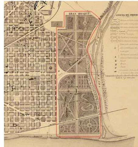
El gran bosc del Besòs projectat per Ildefons Cerdà l'any 1859

La Catalana sorgí per allotjar els treballadors de l'empresa elèctrica d'aquest nom, establerta el 1917 al costat de la desembocadura del riu. L'empresa Cobasa construí vers 1960 el barri del Besòs , que comportà una gran aportació d'habitants al municipi. Per últim la Mina , amb nom que prové d'una mina que donava aigua a la font d'un concorregut berenador, es va construir el 1970, per un conveni entre l'Ajuntament de Barcelona i l'Institut Nacional de la Vivienda, per tal de traslladar famílies de barraques a grans blocs de pisos, que augmentaren notablement la massificació i despersonalització del veïnat. Aquests barris ocuparen els terrenys que el pla Cerdà contemplava com a gran bosc del Besòs, pulmó de Barcelona. L'actual Parc ocupa una petit bocó del que havia de ser aquest magnífic projecte que afectava 190 hectàrees del marge dret del riu.