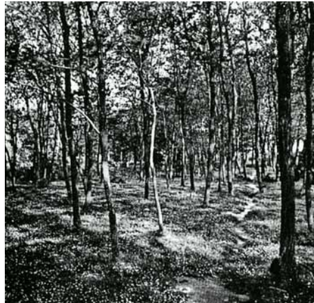
La salzedà del Besòs

Les del Besòs tenien anomenada des d'antic per l'abundància de la caça. Ja en el segle XIV, el rei Joan I de Catalunya, dit el Caçador, hi practicava aquest esport com demostren diferents documents, dels quals transcrivim un fragment: " Com nos dimarts matí primer vinent entenem anar a caça, de porch sen-glar, per açó haiam mester homens de peu pa fer la dita caça, per ça a vos dehim e manam sots pena de C. morabatins d'or que ab tots los homens de la dita paròquia e terme, lo dit dimarts primer vinent a ora d'alba siats al loch de Sant Adrià ab armes couinents per la dita caça, e amenats aquells cans que pugats. Dada en Barchinona a XVII, de Maig, l'any MCCCLXXXIII ".