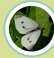
BLANQUETA DE LA COL PIERIS RAPAE