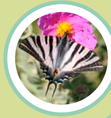
PAPALLONA ZEBRADA IPHICLYDES FEISTHAMELII