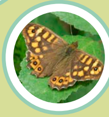
BRUNA DE BOSC PARARGE AEGERIA