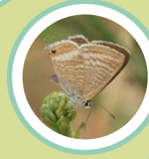
BLAVETA DELS PÈSOLS LAMPIDES BOETICUS