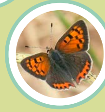
COURE COMÚ LYCAENA PHLAEAS