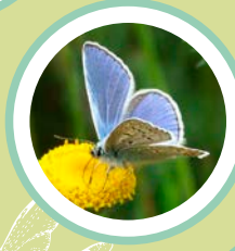
BLAVETA COMUNA POLYOMMATUS ICARUS