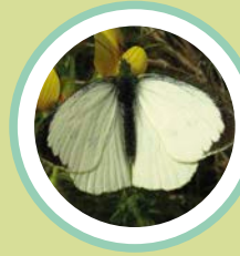
BLANCA DE LA COL PIERIS BRASSICAE