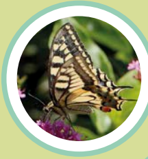
PAPALLONA REINA PAPILIO MACHAON