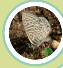
BLAVETA ESTRIADA LEPTOTES PIRITHOUS