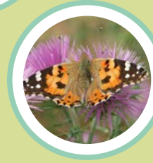
MIGRADORA DELS CARDS VANESSA CARDUI