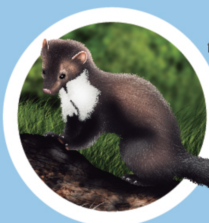
FAGINA Martes foina