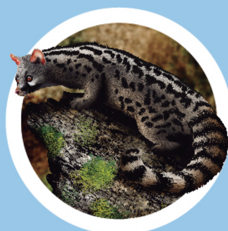
GENETA Genetta genetta