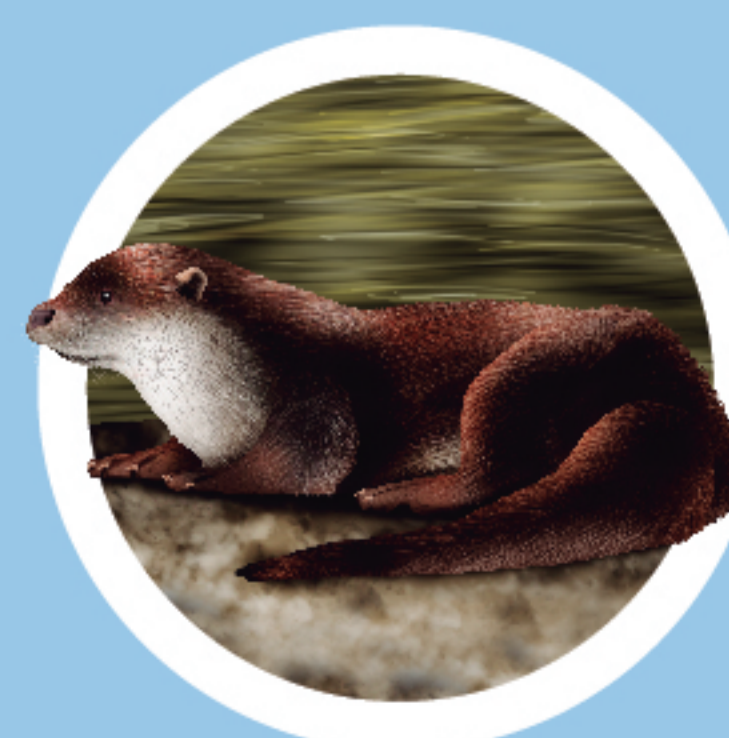
LLÚDRIGA Lutra lutra