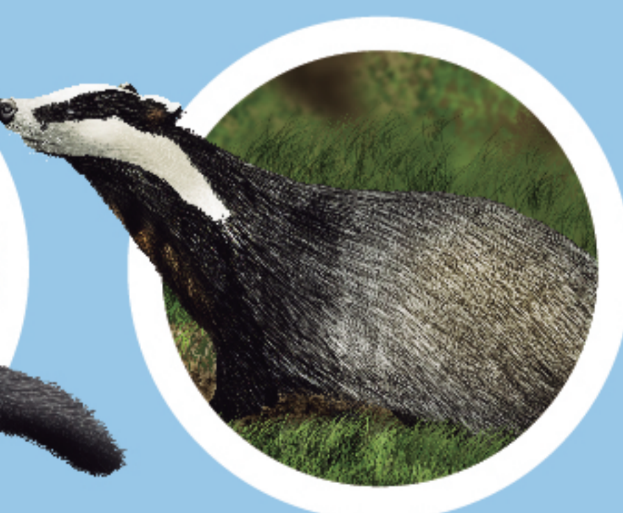
TEIXÓ Meles meles