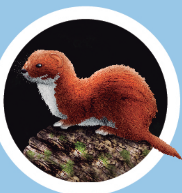
MOSTELA Mustela nivalis