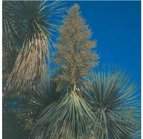
fulles i flors